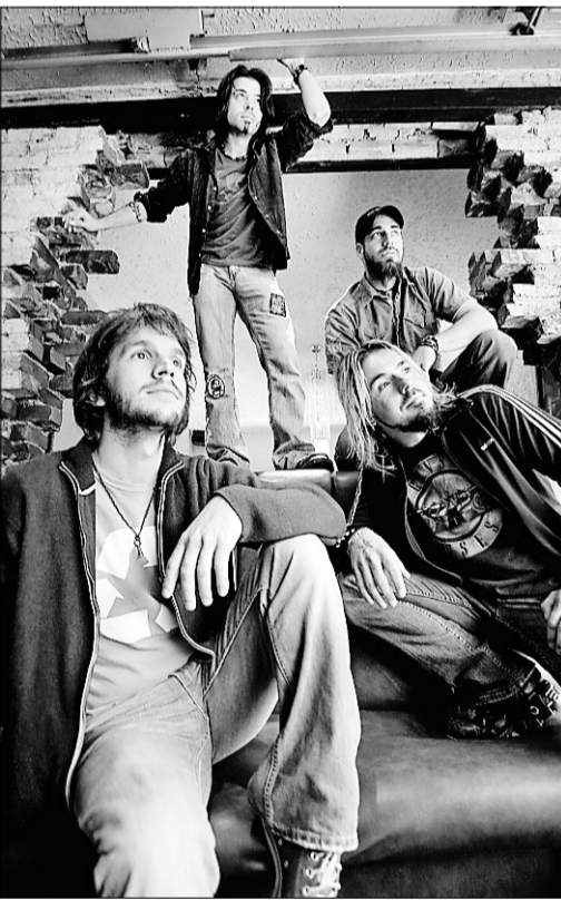
Le groupe Kain s'offre deux fois le Métropolis.

- Mario Cloutier DEMAIN, 13H, AU CENTRE CANADIEN D'ARCHITECTURE