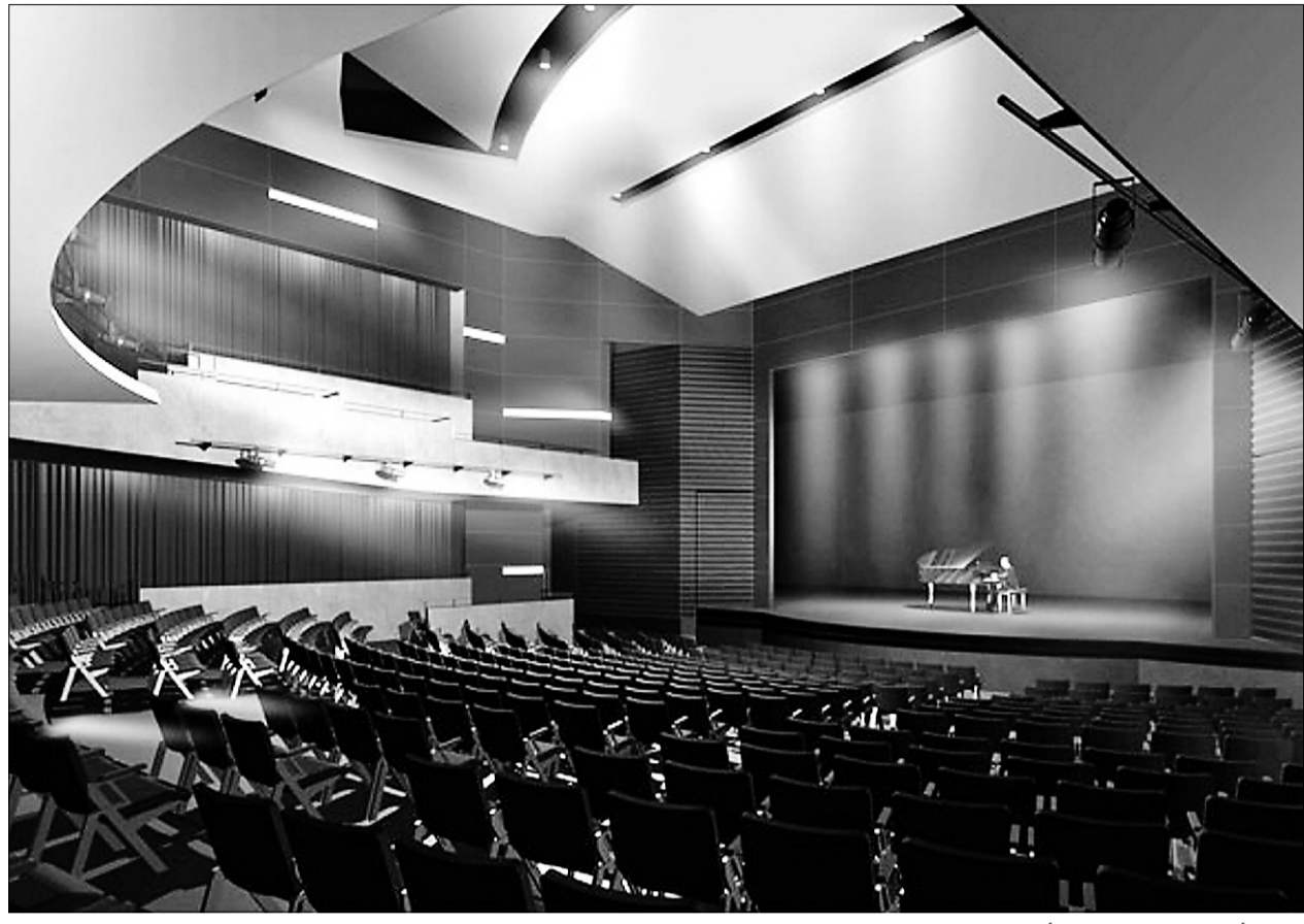
La salle de L'étoile, qui pourra accueillir jusqu'à 1000 spectateurs, est située dans le complexe commercial DIX30, à l'intersection des autoroutes 10 et 30.

Michel Rivard, de son côté, y sera le 3 avril, première étape d'un tour du chapeau de la