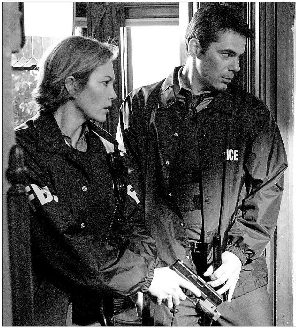
Diane Lane et Billy Burke font partie de la distribution de Untraceable , un suspense somme toute assez efficace.

l'informatique, capable de brouiller les pistes en deux clics. Une femme (Diane Lane) et quelques brillants collègues tâcheront de suivre les traces du tueur lequel, par son esprit ludique, laisse toujours sur son passage des signes mystérieux, des indices.