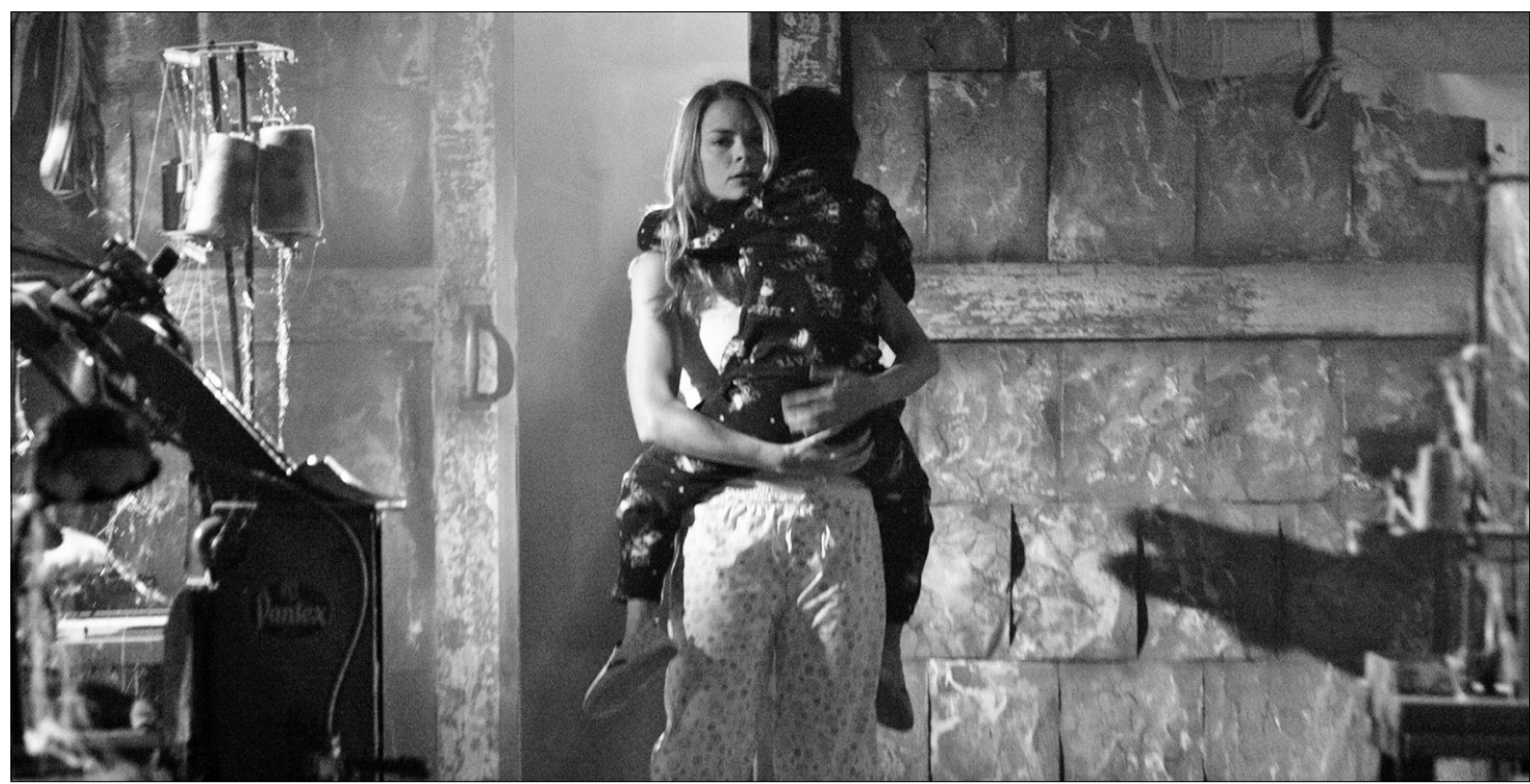
They Wait, du Canadien Ernie Barbarash, par ailleurs fort bien réalisé et techniquement irréprochable, souffre d'un grand manque d'originalité.