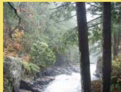
Parc des chutes de Sainte-Ursule

La Route des Rivières devient la treizième route reconnue par le comité de signalisation des routes et des circuits touristiques. Ce comité, présidé par le ministère du Tourisme, regroupe aussi des représentants du ministère des Transports et des ATR associées du Québec.