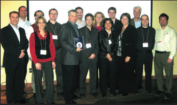
Réseau expert Direction de l'amélioration continue

Au cours de la dernière année, MEQ a géré et animé les rencontres de partage de meilleures pratiques de sept réseaux d'experts. Les réseaux Approvisionnement , Chargés de projets en amélioration continue , Développement durable , Direction de l'amélioration continue , Gestionnaires de maintenance , Santé et sécurité ainsi que Supervision et leadership comptent chacun entre 30 et 70 membres, gestionnaires, superviseurs, mais surtout, des leaders dans leur domaine d'expertise. Plusieurs entreprises manufacturières, chefs de file dans leur secteur, telles qu'Alcoa, BRP, Bombardier Aéronautique, Cascades, Canlyte, Domtar, GE Bromont, IBM Bromont, Les Emballages Knowlton, Mabe, Paccar, Pfizer, Pratt & Whitney Canada et Prinoth, ont présenté leurs meilleures pratiques à l'occasion d'une trentaine de rencontres.