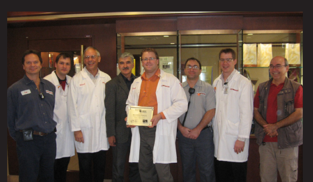
Visite Innovation illimitée chez Barry Callebaut

L'année dernière, les 35 visites industrielles du programme Innovation illimitée ont permis à près de 800 représentants d'entreprises manufacturières et exportatrices, de découvrir les meilleures pratiques d'affaires de plusieurs entreprises performantes du Québec. Les participants ont visités : AREVA T&D Canada Inc., Barry Callebaut Canada Inc., EXFO, MAAX, Premier Tech, Teknion et plusieurs autres. Les entreprises hôtes ont partagé leurs meilleures pratiques d'affaires sur des thèmes tels que : la chaîne d'approvisionnement, la gestion des processus et la planification stratégique, le «Lean Manufacturing», la maintenance des équipements ou les ressources humaines.