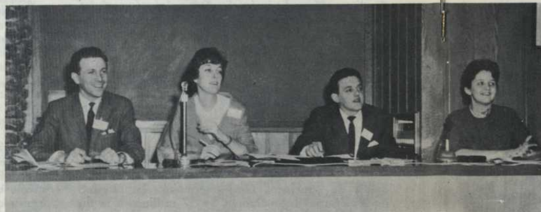
Les mouvements de jeunesse ont aussi participé activement aux programmes du congrès. Quatre de leurs représentants répondent ici aux questions qui inquiètent ceux qui, demain, prendront la relève.