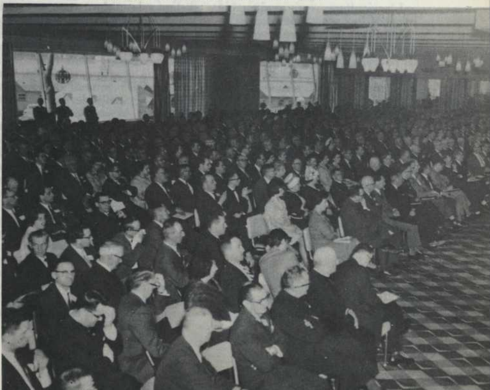
Une partie de l'assistance à la séance d'ouverture.