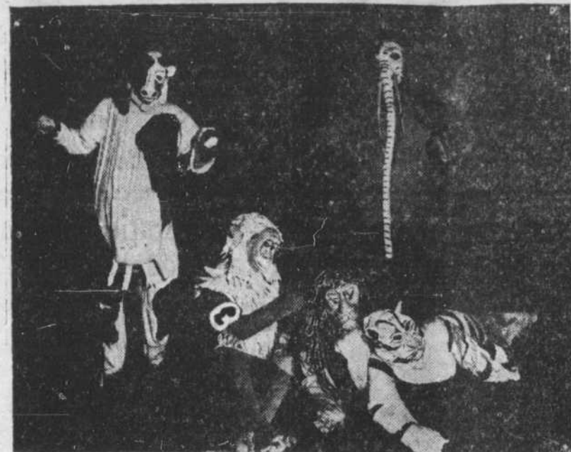
La vache, le singe, le lion, le tigre et l'éléphant, quelques-uns des animaux du 'NOE' d'André Obej, dont les représentations données au Gesù par les COMPAGNONS...