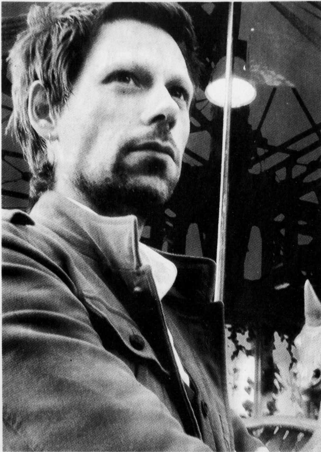
FRANCOFOLIES DE MONTRÉAL

L'album Casino sera décisif dans la propagation d'Arman Méliès auprès d'un public plus large: la voix y est moins noyée à l'anglo-saxonne dans le mixage, et Méliès émerge de son beau jardin anglais de musique.