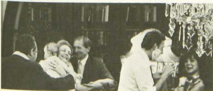
Je t'aime, je te tue

Présentée en langue allemande et sous-titrée, la production est en soi très originale. Se rapprochant du Roi de coeur de Philippe de Broca par le dépaysement et cette étrange folie qui s'en dégage, ce film appartient au surréalisme et fait surtout ressortir l'absurde et le paradoxal des contingences sociales, réelles ou irréelles. On y traite aussi du thème de l'innocence de l'homme qui, à sa naissance, est projeté dans une société dont il ne connaît aucunement les règles, et qui les a encore moins instaurées.