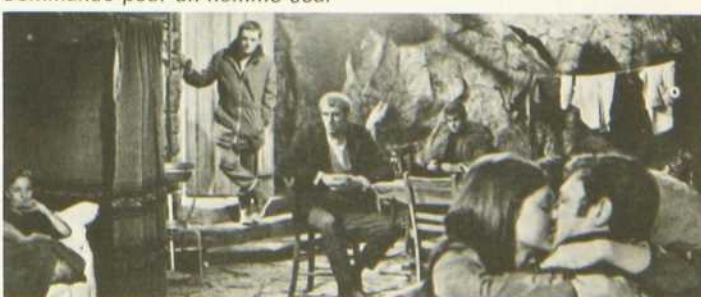
Commando pour un homme seul

Ce film remémore la gloire des «mounties» du début du siècle. Ce témoignage de courage et de bravoure montre la lutte qu'engagèrent les «tuniques rouges» contre des éléments naturels implacables et contre le désordre qui dominait l'Ouest canadien à l'époque de sa colonisation.