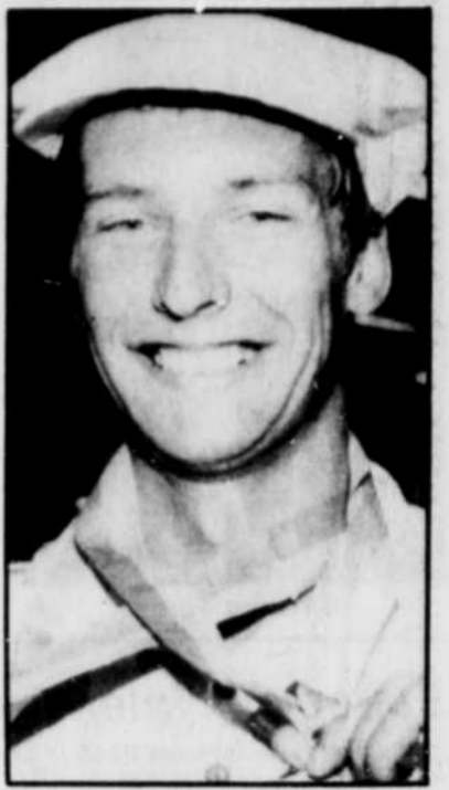
Alex Baumann: premier