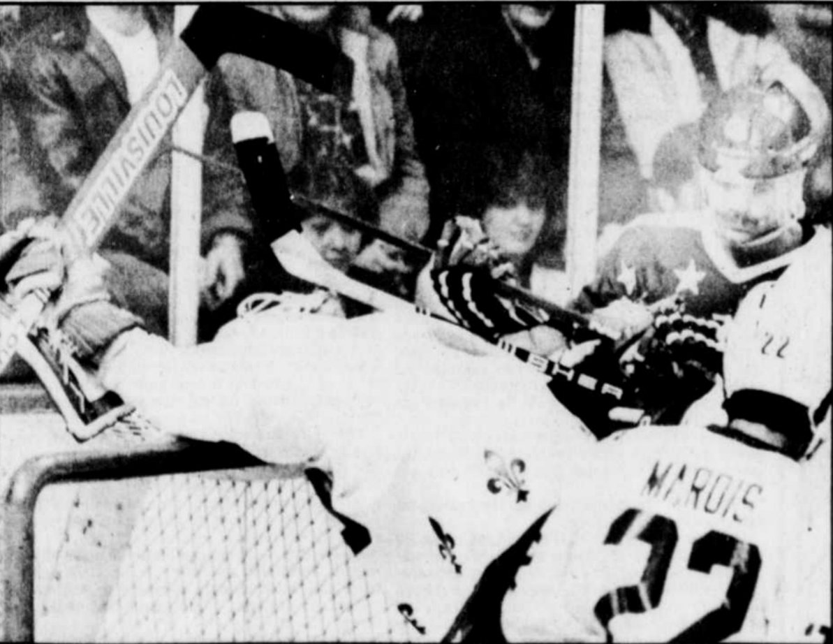
Pendant que Mike Gartner et Mario Marois se regardaient dans le blanc des yeux, c'est le gardien Daniel Bouchard qui a écopé en recevant sous le menton le "bâton égaré" de Gartner.