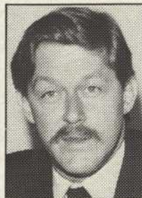
Pierre Olivier les actualités