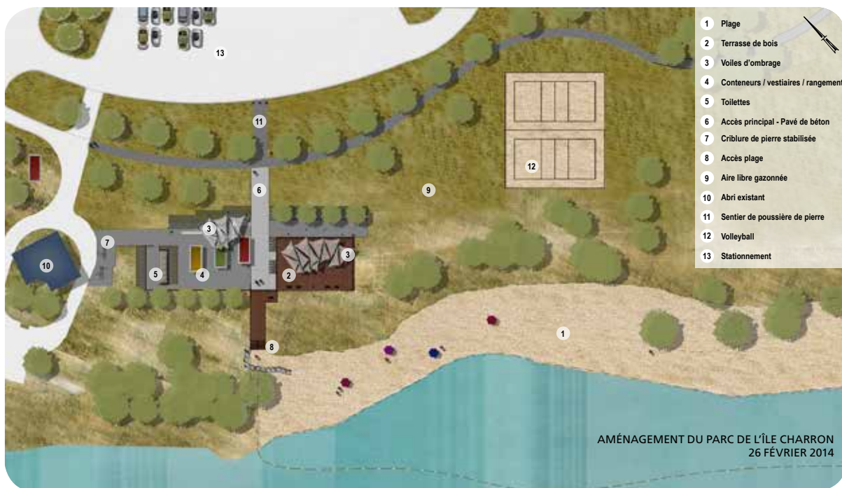
AMÉNAGEMENT DU PARC DE L'ÎLE CHARRON 26 FÉVRIER 2014

Ce projet prévoit également l'aménagement d'un terrain de volleyball, d'une terrasse en bois, de voiles d'ombrage et de nouvelles installations sanitaires. Des végétaux et du mobilier de parc seront également ajoutés afin de rendre les lieux plus conviviaux pour les visiteurs. Une partie des équipements qui seront intégrés au site, comme des voiles pare-soleil et des conteneurs colorés, seront récupérés des deux premières phases du Marché public de Longueuil.