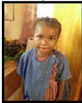
Audience 6 ans, 1 ère année Madagascar