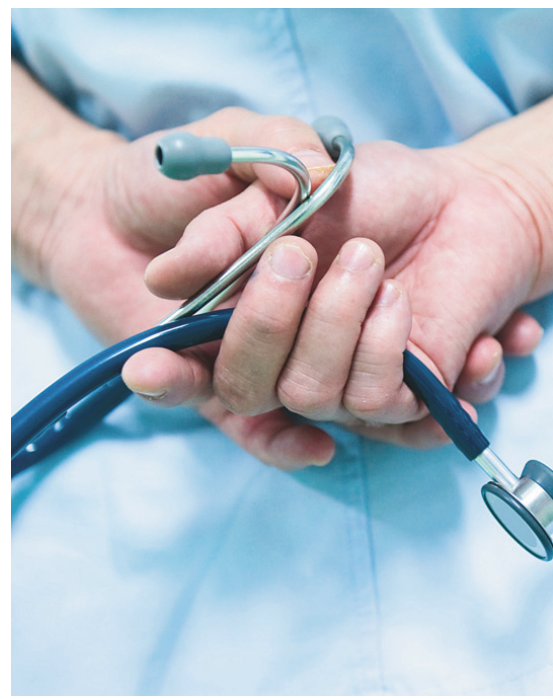
La rémunération des médecins n'est qu'un symptôme d'une grave pathologie dans le processus de prise de décision

Elle tente de faire entendre sa voix dans un débat dans lequel elle est forcée de rester assise sur le banc des joueurs. Le lobby pour la santé de la population est inexistant. Nous avons besoin de ce troisième joueur au banc des négociations pour exiger la convergence des influences qui bâtissent notre système de santé.