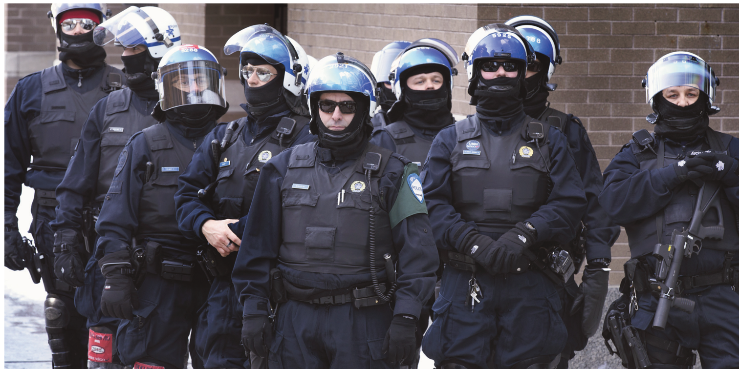
À propos de la présence d'agents infiltrés, le porte-parole du SPVM répond que «cela fait partie de [ses] stratégies».