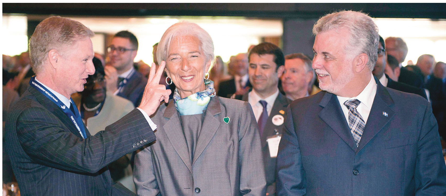
Le politicien aguerri est celui qui a cultivé un bon réseau de contacts. Sur la photo, Paul Desmarais, de Power Corporation, Christine Lagarde, directrice générale du Fonds monétaire international, et Philippe Couillard, premier ministre du Québec, lors d'une conférence à Montréal.