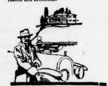
A 50 ans, il peut se payer un luxe raisonnable.