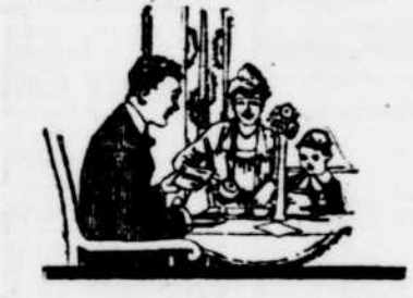
A 35 ans, au nombre des factures qu'il reçoit se trouve un "avis d'échéance de prime" qui, bien que considéré comme un déboursé, est en réalité une économie.