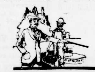
A 60 ans, il vit sans inquiétude du lendemain et surveille à loisir ses intérêts.