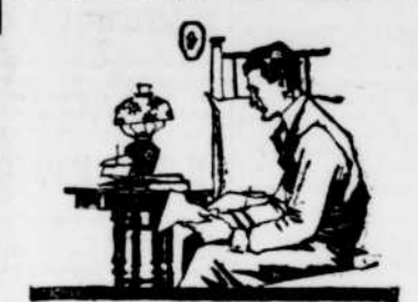
A 19 ans, ses dettes dépassent son revenu.