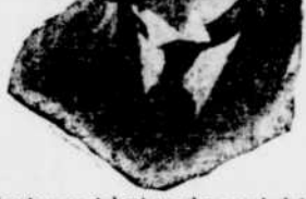
Le jeune violoniste slave qui doit donner un grand récital de violon, ce soir, à l'hôtel de ville.