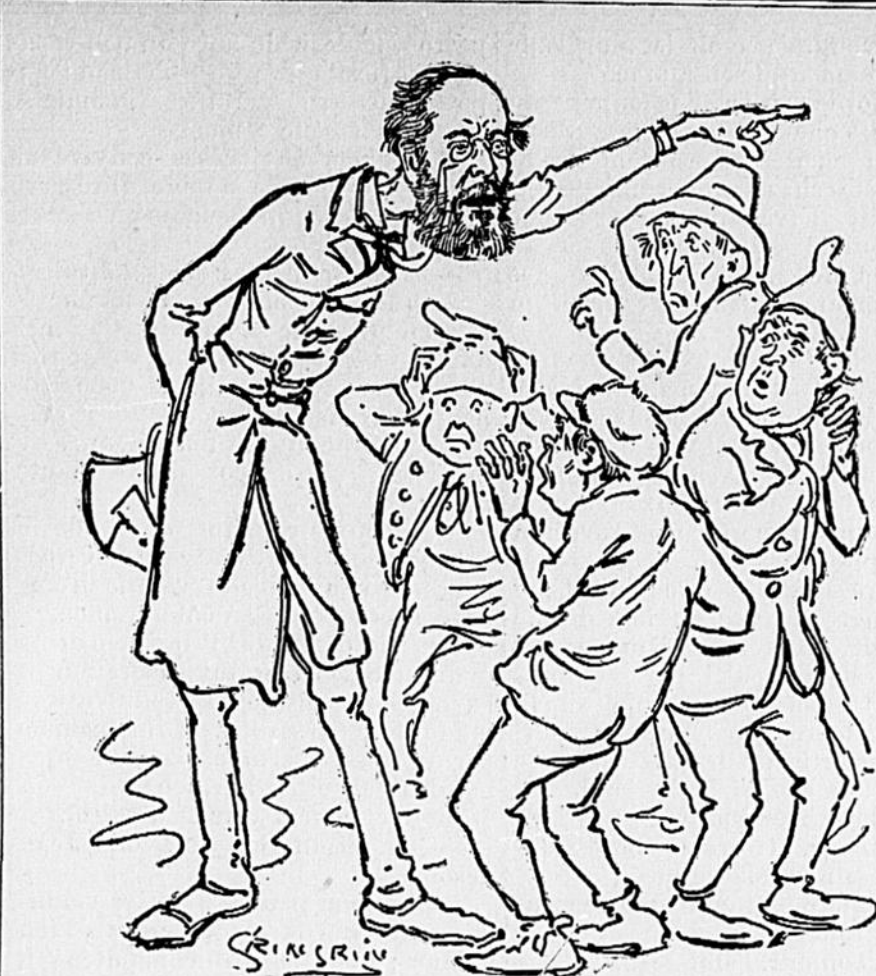
DANS LE COMTÉ DE L'ASSOMPTION

Nous avons vu aussi un maréchal ferrant prendre avec la main et jeter un fer rougi qui était tombé sur la cuisse d'un cheval entravé. Certains maréchaux prennent également avec leurs mains, dans le feu de la forge, un fer à cheval chauffé à blanc et le posent sur l'enclume. Un vieil ouvrier de