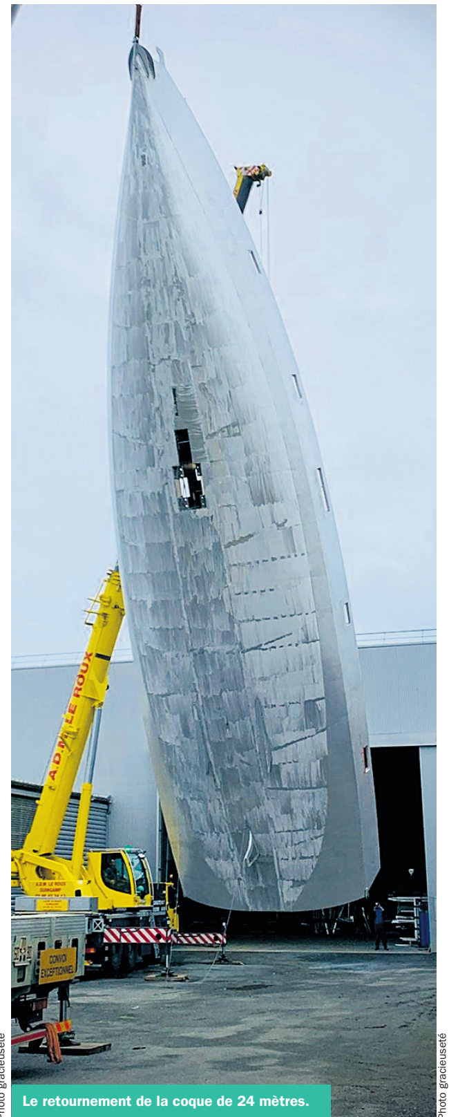
Le retournement de la coque de 24 mètres.

Chers nouveaux citoyens, Chères nouvelles citoyennes,