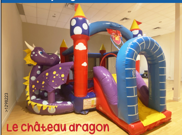
Le château dragon

Nouveau jeu gonflable pour 5 ans et moins