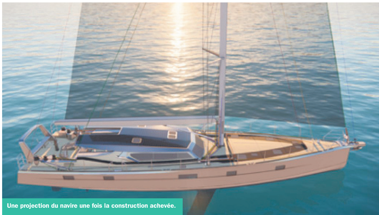
Une projection du navire une fois la construction achevée.