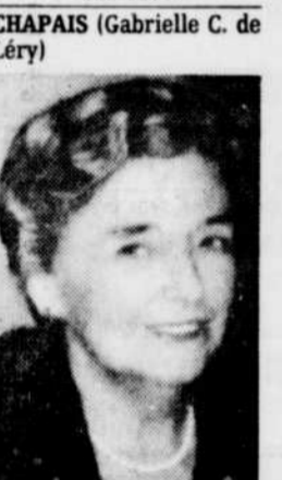
à Québec, le 10 octobre 1991, à l'âge de 99 ans,