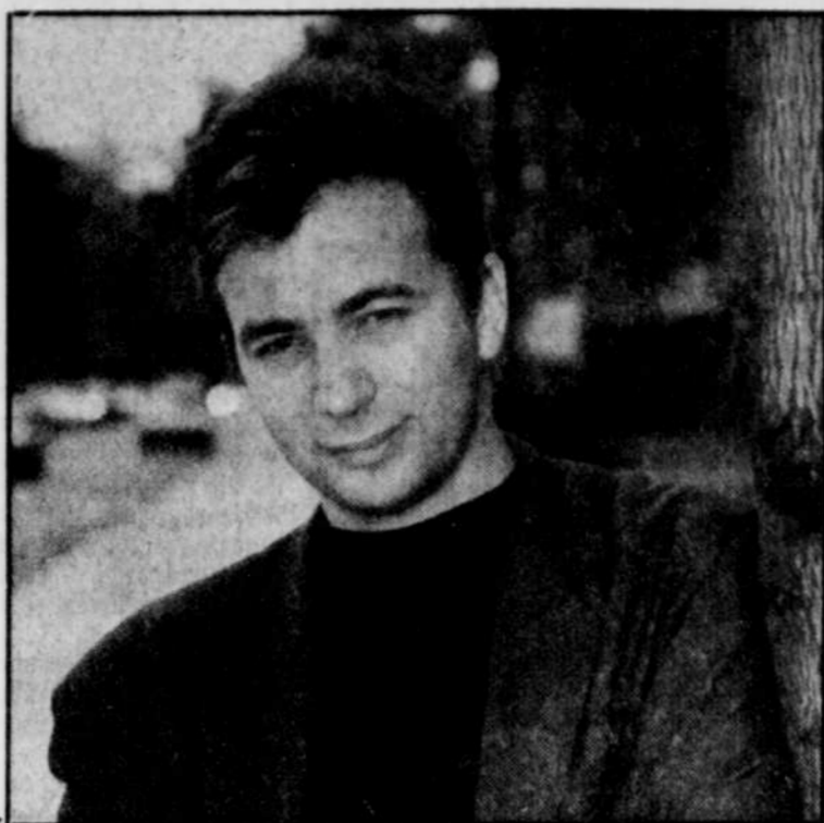
Luc de Larochellière, en nomination dans les catégories « Chanson populaire », « Interprète masculin » et « Microsillon pop rock ».