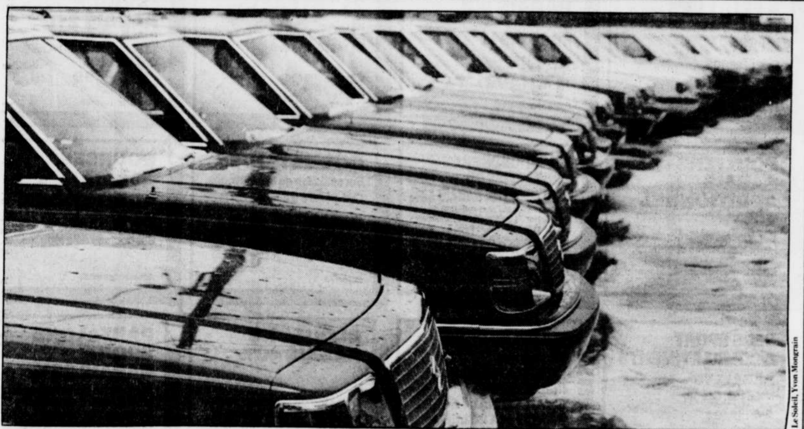
Saint-Raymond est reconnue comme « la ville de l'automobile ».

LE SOLEIL, fondé en 1896, est imprimé au 390, rue Saint-Vallier Est, Québec G1K 7J6, par LE SOLEIL (Division de Groupe Unimedia) qui est un éditeur. Seule la Presse canadienne est autorisée à utiliser et à diffuser les informations publiées dans LE SOLEIL. LE SOLEIL (USPS #003709) is published daily at 390, East St. Vallier Street, Québec City, Québec G1K 7J6. Subscription rate per year is $31.48 $ (Canadian funds). Second Class Postage paid at Champlain, N.Y. U.S. Postmaster: Send address changes to: INSA, P.O. Box 1518, Champlain, N.Y. 12919-1518.