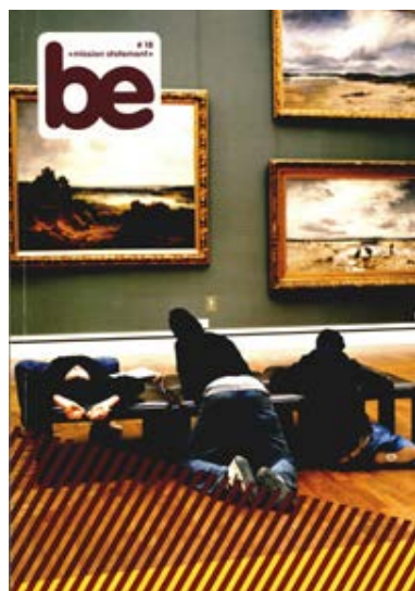
Bilan annuel de la Künstlerhaus Bethanien

Le CALQ est toujours heureux de recevoir ces témoignages qui confirment la pertinence des actions qu'il poursuit pour soutenir la création, l'expérimentation et la production dans les domaines des arts et des lettres et en favoriser le rayonnement, notamment par le développement de son réseau d'ateliers-résidences.