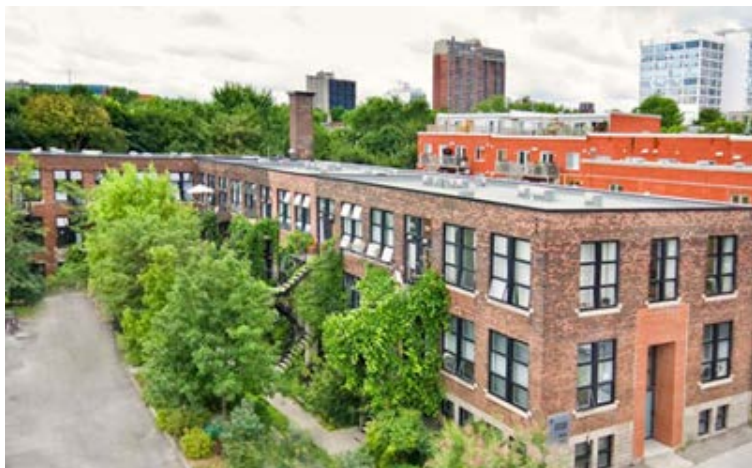
La coopérative Lezarts.

Partenaire du CALQ dans l'accueil d'artistes étrangers séjournant au Québec dans le cadre d'ententes formelles avec ses partenaires, la coopérative Lezarts s'apprête à fêter son 10 e anniversaire, ce qui donnera lieu à divers événements.