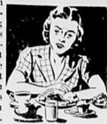
Ne peut Manger

LA PLUPART des gens souffrent, de temps à autres, d'une mauvaise digestion ou "d'indigestion" comme cela est souvent nommé. Les causes d'une mauvaise digestion sont nombreuses; deux des plus communes sont l'abus de nourriture et l'absorption d'aliments gras ou indigestes. Mais quelle qu'en soit la cause, une mauvaise digestion rend une bonne santé impossible — et les gens qui souffrent de ce mal savent combien il les rend misérables.