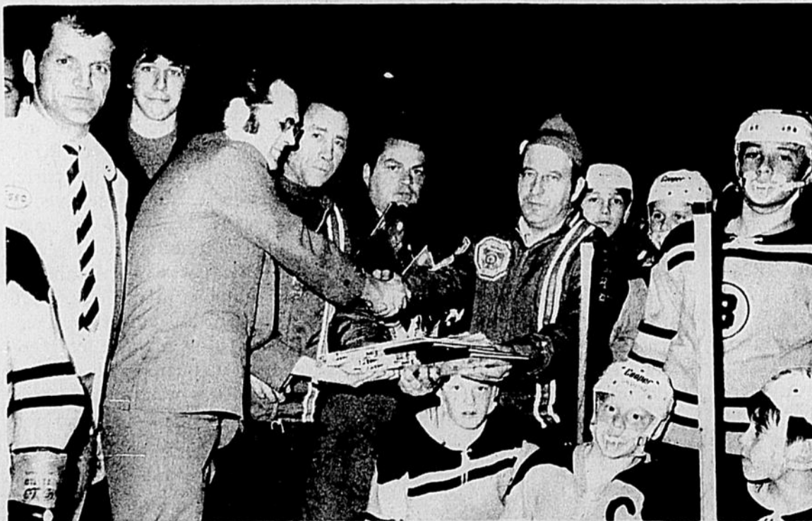
Les perdants finalistes ne furent pas oubliés, lors du tournoi Pee Wee. Un album: "Les Grands du Hockey" était remis à chaque joueur de ces équipes vaincues. Une scène