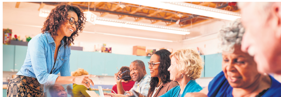
Sport, culture, bénévolat, les occupations ne manquent pas.

Que ce soit à travers le sport, la culture ou l'engagement communautaire, il y a une activité pour chaque intérêt et chaque individu. Alors que l'été tire à sa fin, c'est le moment idéal pour explorer de nouvelles avenues et enrichir son quotidien.