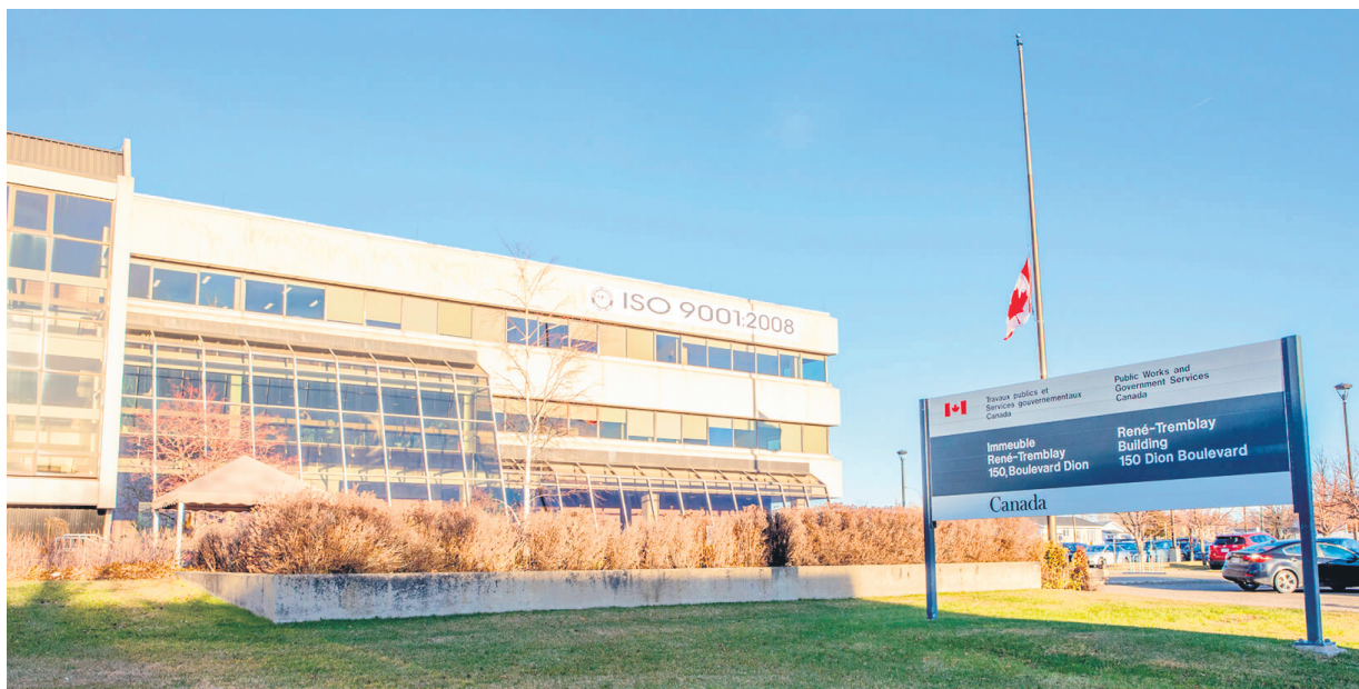
L'édifice René-Tremblay a été le théâtre d'une évacuation à la suite de la découverte d'une enveloppe suspecte.

L'enquête est toujours en cours pour déterminer la provenance de l'enveloppe maudite qui a provoqué tout ce branle-bas de combat. Services publics et approvisionnement Canada confirme que du soutien psychologique a été offert aux employés et que des experts en matières dangereuses ont aussi été envoyés sur place. On indique qu'en tout temps, la sécurité des employés était au cœur de leurs décisions. C'est ce qui allait d'ailleurs dicter à l'organisme fédéral si le bâtiment allait être réintégré la journée suivante.