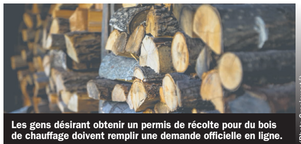
Les gens désirant obtenir un permis de récolte pour du bois de chauffage doivent remplir une demande officielle en ligne.

Pour les gens désirant obtenir un permis à des domestiques, ils doivent remplir une demande à l'un des points de services du ministère des Forêts, de la Faune et des Parcs.