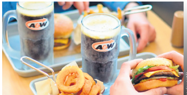
Un teen burger pour soutenir la lutte à la sclérose en plaques.