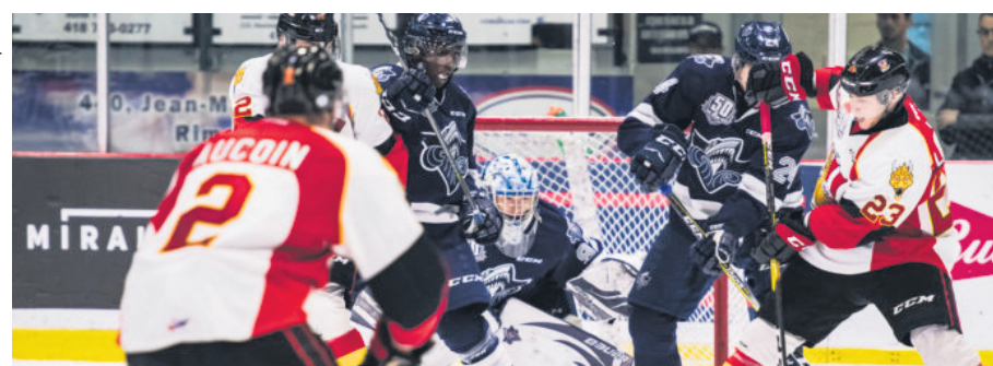
Le Drakkar et l'Océanic, deux formations à surveiller en 2024-2025 croiseront le fer à Matane.

Ensuite, il y aura un match de hockey senior le samedi 21 septembre à 19 h au Colisée Béton Provincial alors que Metal Pless de Plessisville affrontera Metal Perreault de Donnacona dans un duel où l'intensité et l'agressivité seront au rendez-vous. « Il s'agit d'une ligue avec un bon calibre de joueurs alors qu'on en retrouve plusieurs qui n'avaient tout simplement pas envie de poursuivre dans la ligue nord-américaine. Il y a aussi des anciens de la ligue de hockey junior maritimes du Québec », poursuivent les organisateurs. Dans ce cas, les billets seront aussi en vente dès le 22 août dans les mêmes points de vente mentionnés ci-haut.