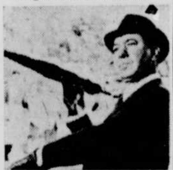
A l'émission Cinéma du vendredi 24 août à 23h, Radio-Canada vous présente "Moi et les hommes de 40 ans".