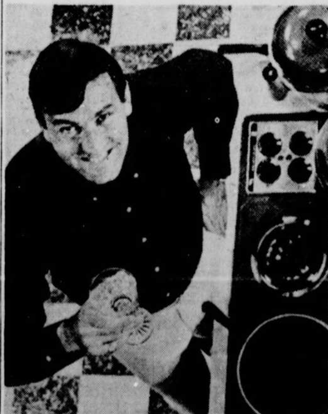
Du lundi au vendredi à 11h, c'est le gourmet farfelu qui vient égayer les cuisines des téléspectateurs de Radio-Canada. ■