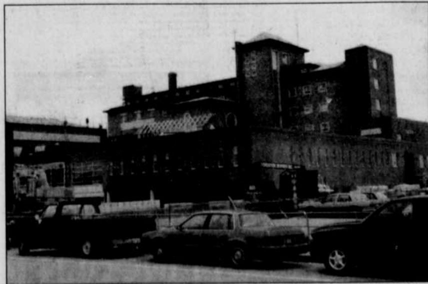
L'agrandissement de l'hôpital de Baie-Comeau est attendu depuis les années 80 et devrait être terminé en juillet 1998. Aucun dépassement de coûts n'est prévu.

L'hôpital conserve ses 120 lits mais une unité interne de psychiatrie sera construite. Bien sûr, les usagers et le personnel doivent s'armer de patience puisque ses travaux bousculent quelque peu le fonctionnement de l'hôpital.