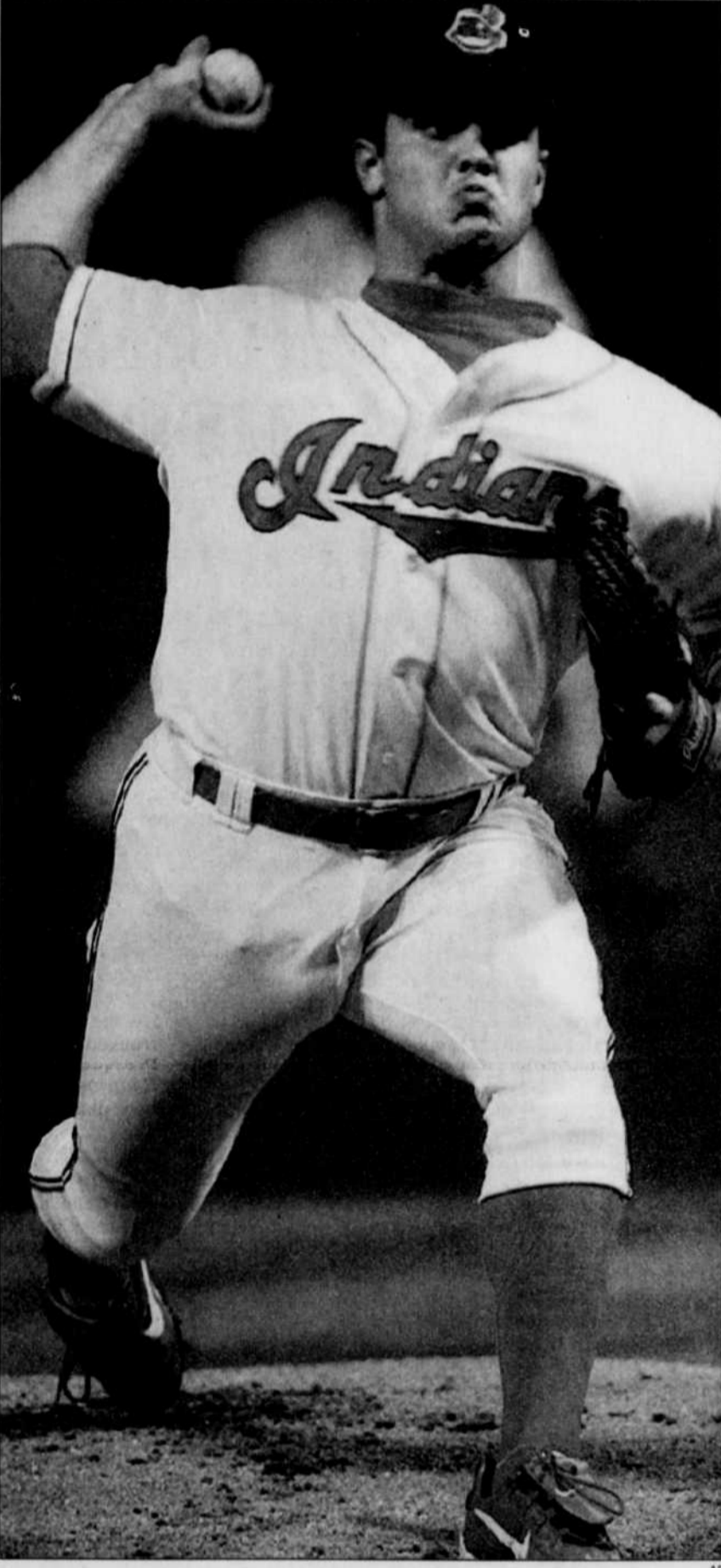
La recrue des Indians, Jaret Wright, a effectué de l'excellente besogne au monticule forçant les Yankees à frapper plusieurs balles au sol. Les Indians ont éliminé les Yankees 4-3, hier, et ils affronteront maintenant les Orioles à Baltimore demain en Série de championnat.