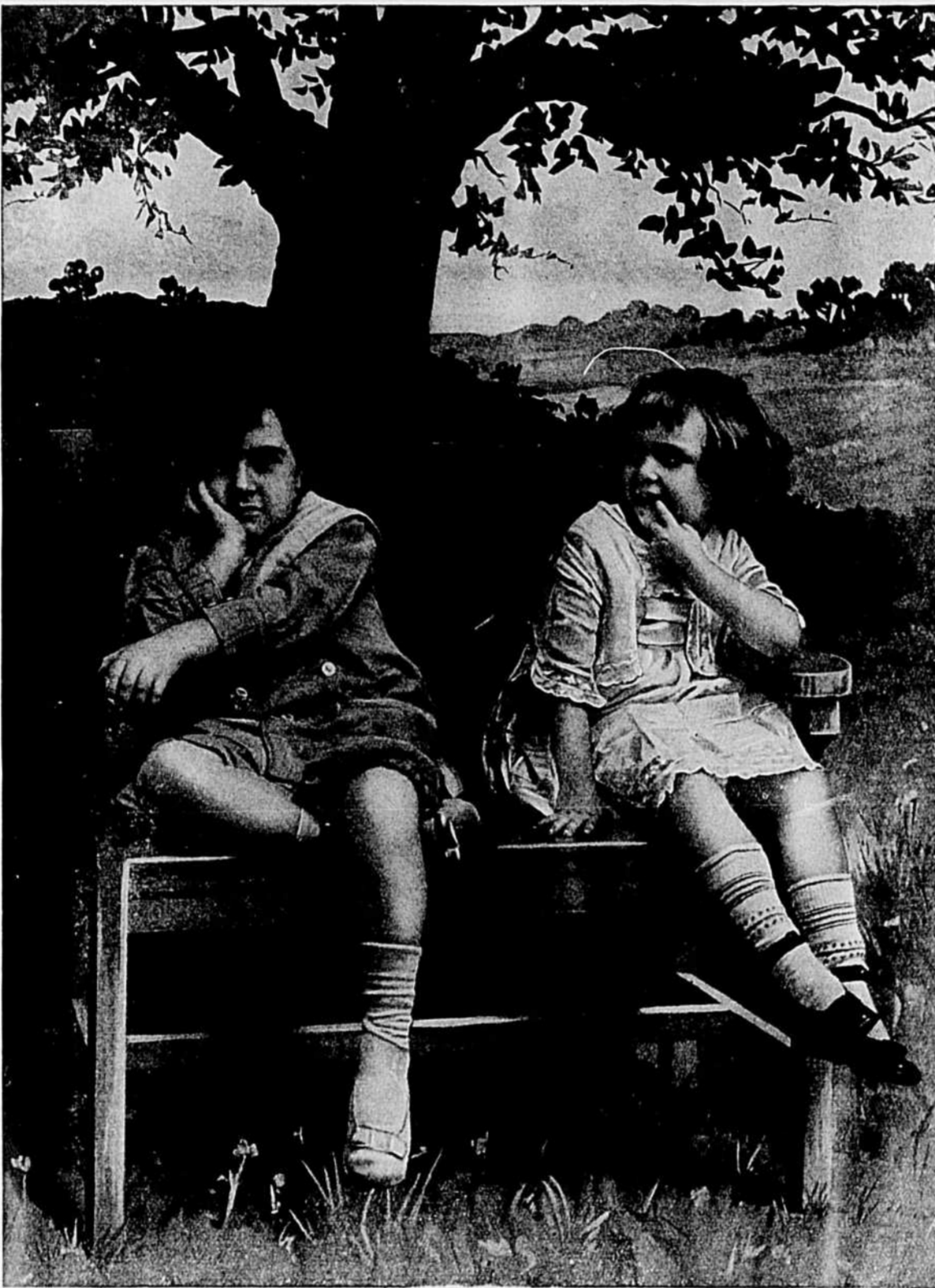
LET'S MAKE UP

As December advanced the visits of the Indians became less frequent