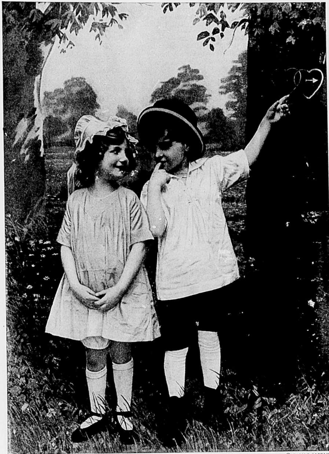
TWO HEARTS THAT BEAT AS ONE

"A Merry Christmas to you all, maters and misters, too; May God preserve us all from harm, ourselves as well as you."