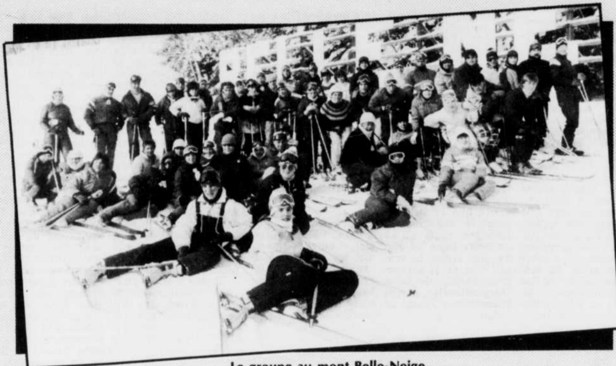
Le groupe au mont Belle-Neige.