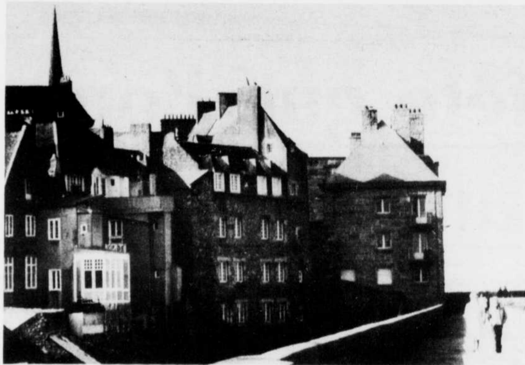
Saint-Malo, repaire des corsaires français qui pillaient les flottes anglaises, ne sera pas beaucoup plus qu'à un jet de pierre

Après cette nouvelle pause, le projet est relancé en 1981. Il aboutira par l'acte historique et hautement symbolique, pour reprendre leur expression, qu'a constitué, le 19 janvier dernier, la signature, entre le premier Ministre Margaret Thatcher et le président François Mitterrand, de l'accord technique et financier qui devrait, enfin, transformer en réalité le vieux rêve franco-anglais.