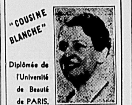
"COUSINE BLANCHE" Diplômée de l'Université de Beauté de PARIS.