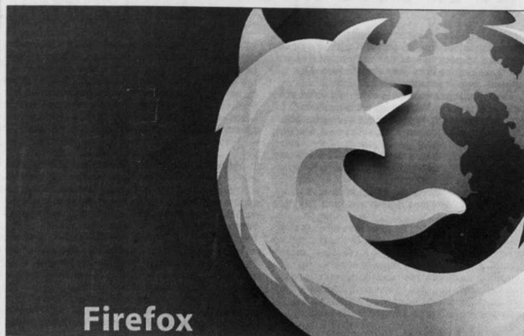
Le navigateur Web Firefox, l'un des logiciels libres les plus utilisés