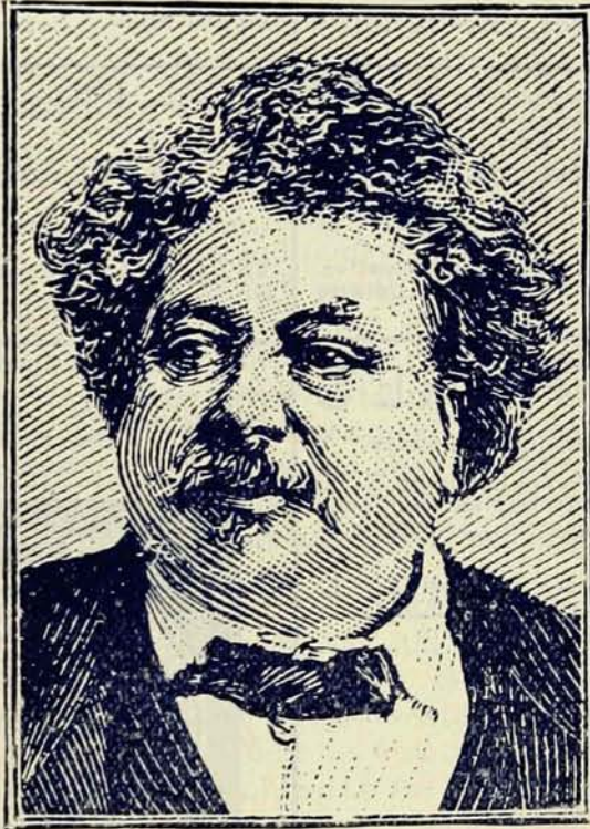
ALEXANDRE DUMAS, PERE

D'HERVEY, qui, au moment où l'action commence, est allé rejoindre son régiment à Strasbourg et a laissé sa femme à Paris.