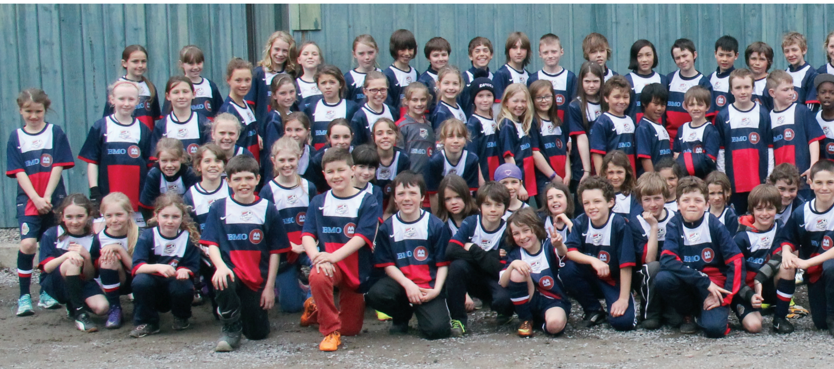
L'ensemble des équipes U9 à U11, volet récréatif Rapides Chaudières-Ouest.

Depuis 2002, l'Association de soccer Chaudière-Ouest (ASCO) se donne comme mission de veiller à la planification d'activités de soccer pour les joueurs et joueuses de tout calibre âgés de quatre ans et plus. Déjà très populaire auprès des jeunes depuis plusieurs années, le soccer continue son ascension impressionnante comme en témoigne l'augmentation nationale du nombre de joueurs de plus de 22 % depuis 2002. L'ASCO est aussi en progression quant au nombre de joueurs affiliés dans les dernières années, et ce sont plus de 1 900 joueurs qui ont porté ses couleurs durant l'été 2014. Cette hausse est aussi attribuable aux impressionnants faits d'armes de l'association dans les dernières années.