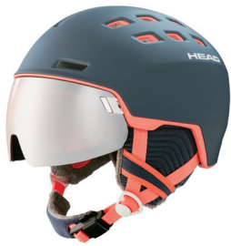
CASQUE À VISIÈRE HEAD POUR HOMMES ET FEMMES NOUVEAUTÉS 2020/2021