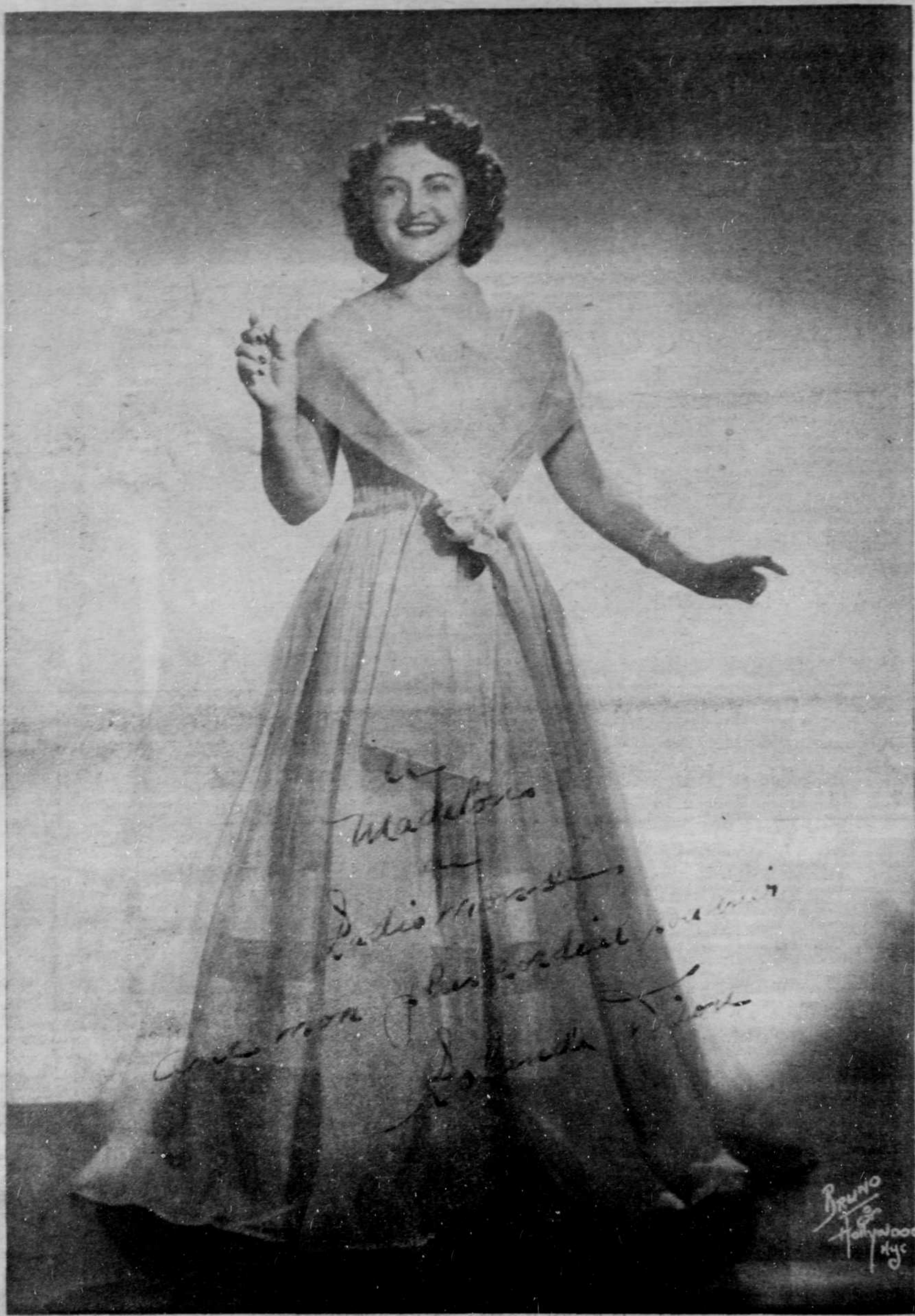
ROLANDE DION, soprano