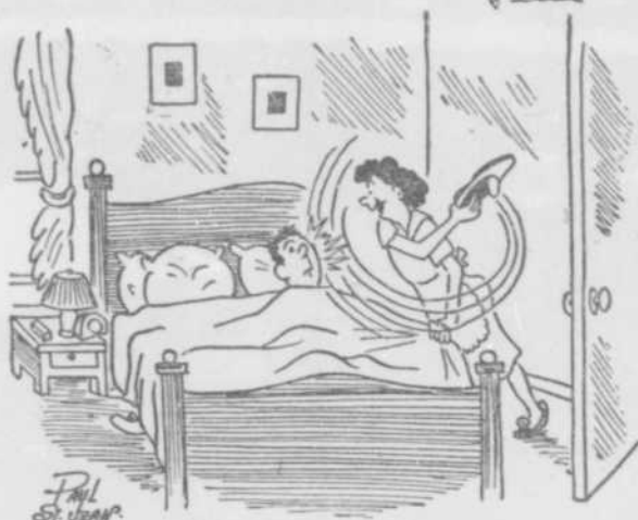
RÉVEILLES-TOI, CHÉRI, ET VIENS ÉCOUTER "LES LA JEUNESSE EN PANTOUFLÉS"!

"Non! Il ne t'appartiendra plus à ce moment. Mais, le sori venu, quand sa tête tombera de sommeil sur ton épaule, tu l'étreindras avec toute la force de tes nerfs tendus. Tu penseras l'avoir encore à toi! Oh... non, pourtant! Il ne sera plus à toi, ton fils! La nuit fera le reste. Le lendemain matin, il s'habillera tout seul, se lavera tout seul, mangera à la hâte, et, après un baiser que les conventions du monde où il est venu lui ont appris, il ira attendre le petit gars du voisin sur le trottoir d'en face. Ce sera encore la maudite école qui le rappellera. Et, par la fenê-