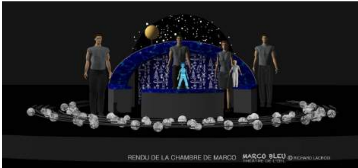
Maquette du décor ©Richard Lacroix

En utilisant ainsi le décor comme une maquette solaire, on dévoile un caractère ludique qui fait directement écho à la manipulation de la marionnette. Pour Richard Lacroix, il était primordial de ne pas illustrer complètement une chambre d'enfant (où vit Marco) ou un lieu extraterrestre (où vit Marco bleu). Au contraire, miser sur l'état du personnage (et sur celui du spectateur) prenait une plus grande importance. En d'autres mots, mieux vaut faire croire que le petit Marco s'imagine sur une autre planète plutôt que de l'illustrer.