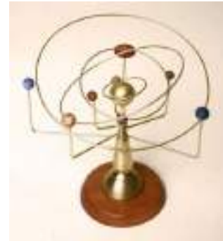
Image d'inspiration