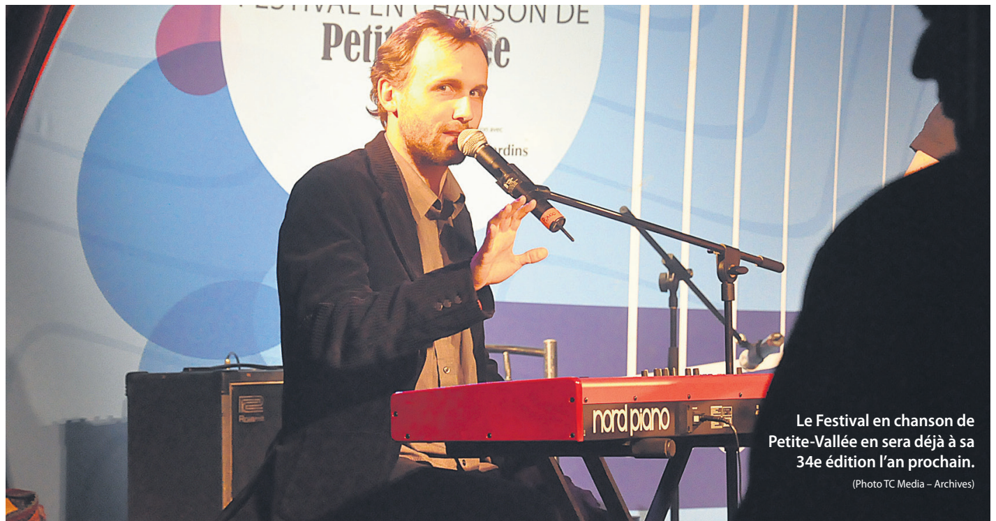
Le Festival en chanson de Petite-Vallée en sera déjà à sa 34e édition l'an prochain.

Concrètement, des changements de dates sont prévus pour la tenue des deux événements. Ainsi, en 2016, le Festival en chanson