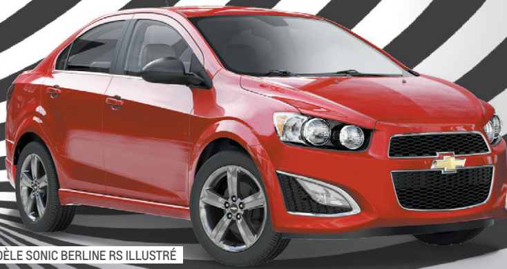
MODÈLE SONIC BERLINE RS ILLUSTRÉ

20% DU PDSF EN RABAIS AU COMPTANT SUR CERTAINS MODÈLES 2015 1