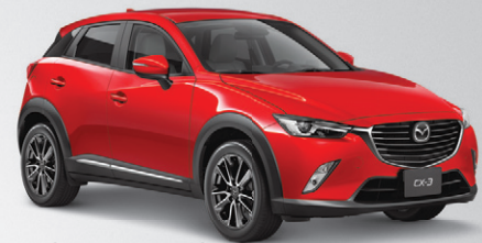
Modèle GT 4RM illustré

Choisir la marque automobile la plus primée au Québec, t'es rendu là.