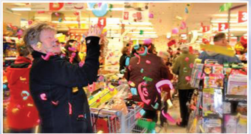
Un moment chanceux avec une ambiance de fête.