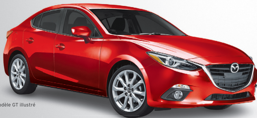
Modèle GT illustré