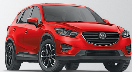
Modèle GT 4RM illustré