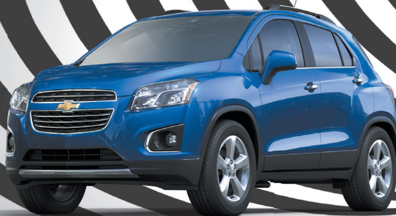
MODÈLE TRAX LTZ ILLUSTRÉ