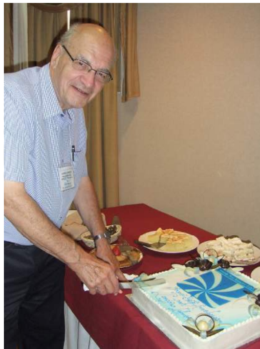
Le fondateur des Langlois d'Amérique a procédé à la coupe du gâteau d'anniversaire soulignant le 30 ième rassemblement.