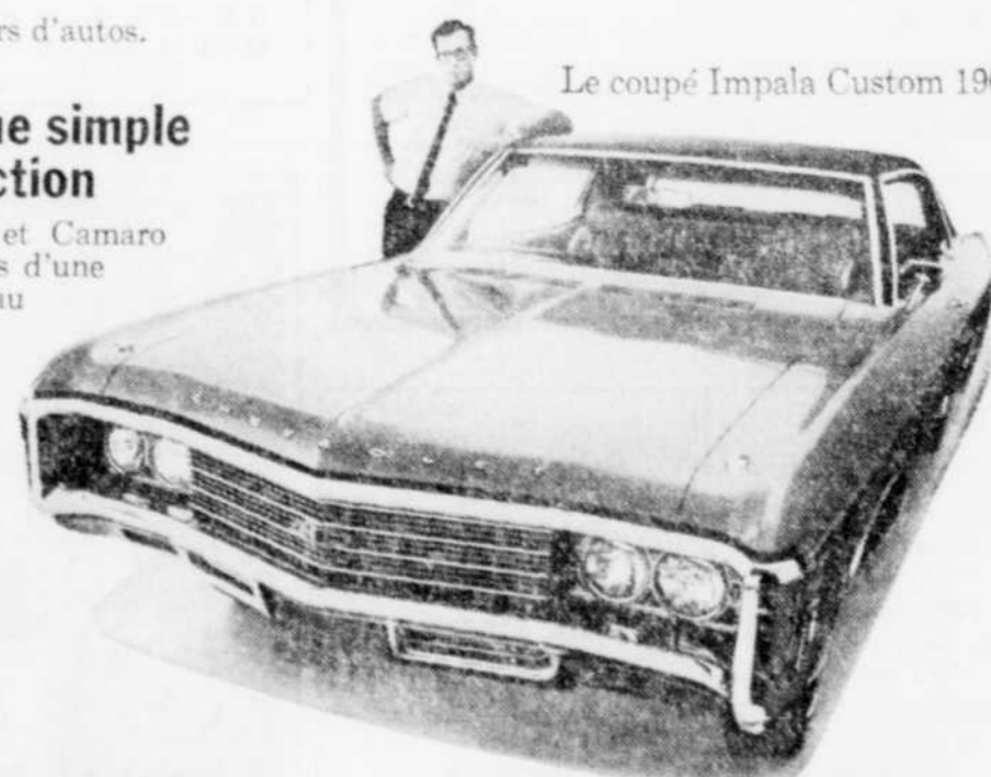
Le coupé Impala Custom 1969.

Penser à vous en premier nous fait rester premiers.