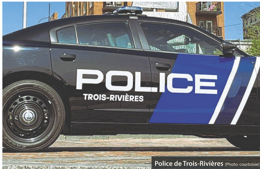
Police de Trois-Rivières

demeurer anonyme va être contrainte à aller témoigner dans un dossier.»