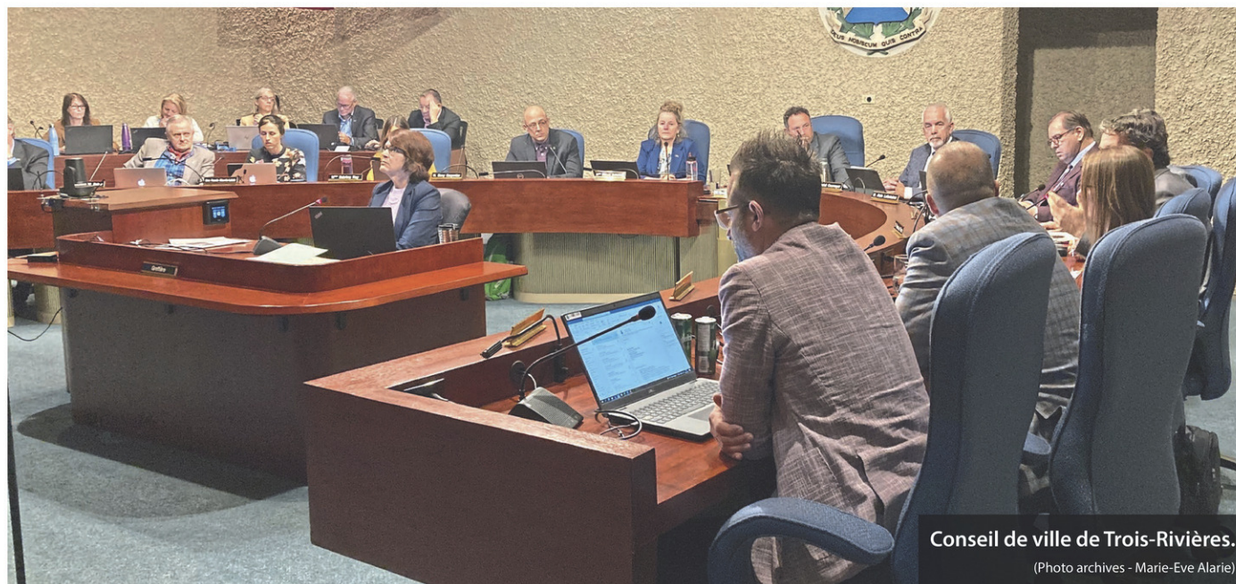
Conseil de ville de Trois-Rivières.

Précisons que les propriétaires concernés, qui seront avisés dans les prochains jours, ne