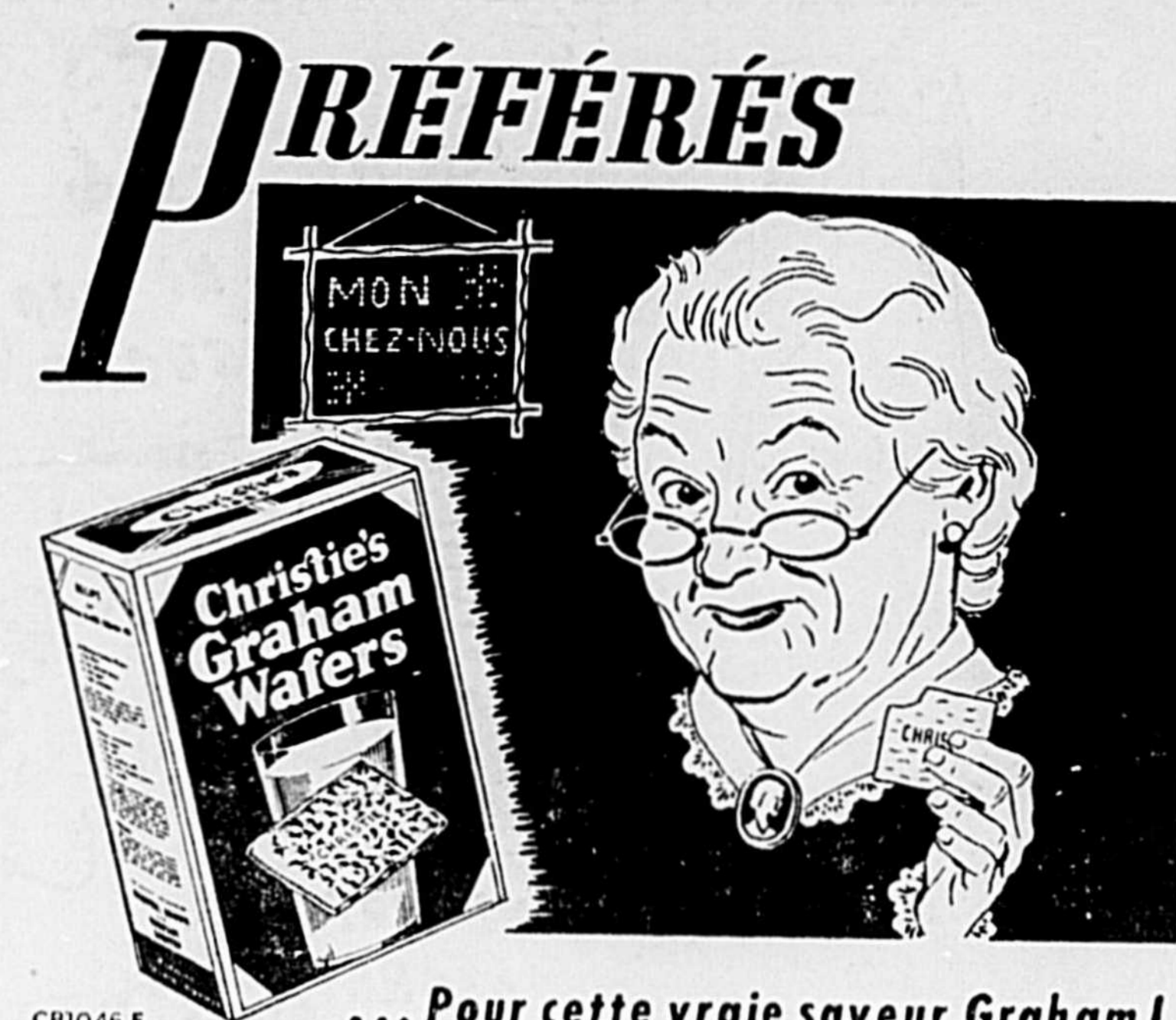
... Pour cette vraie saveur Graham!

Les garde-robes, les tables, les chaises sont toutes manufacturées d'aluminium embouti, enduit d'une couche de plastique translucide. L'intérieur des armoires est recouvert de soie artificielle brossable et traitée chimiquement pour en rendre la surface mortelle aux mites et