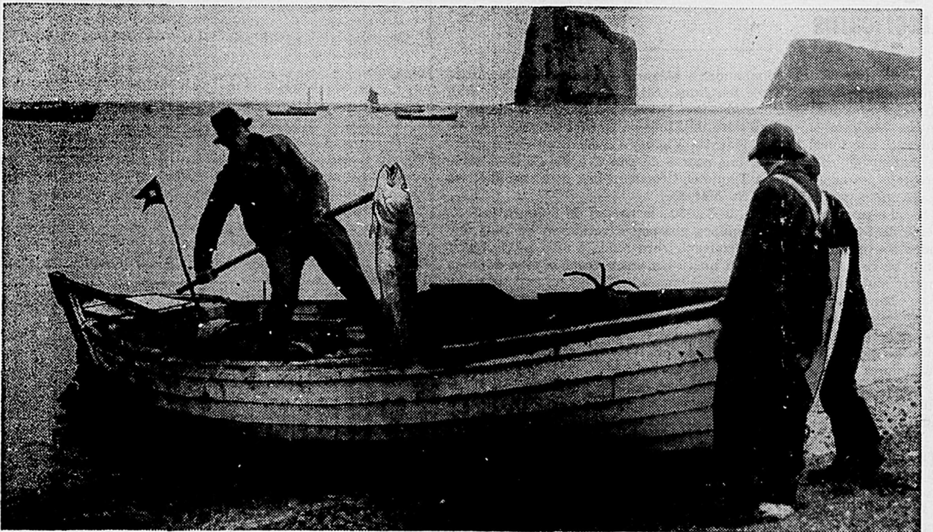
Les pêcheurs du Québec font de belles prises dans l'Atlantique