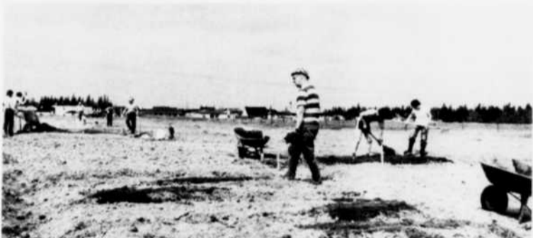
Entre les novices et le jardinier expérimenté, il y a souvent une mer de connaissances que les uns et les autres ne demandent qu'à partager.