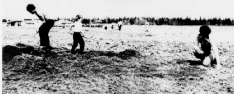
Le pouce vert se transmet de père en fils, aux Jardins communautaires Alcan.

Les idées et les conseils fusent de toutes parts. Un climat d'entraide s'installe déjà entre les jardiniers des Jardins communautaires Alcan.