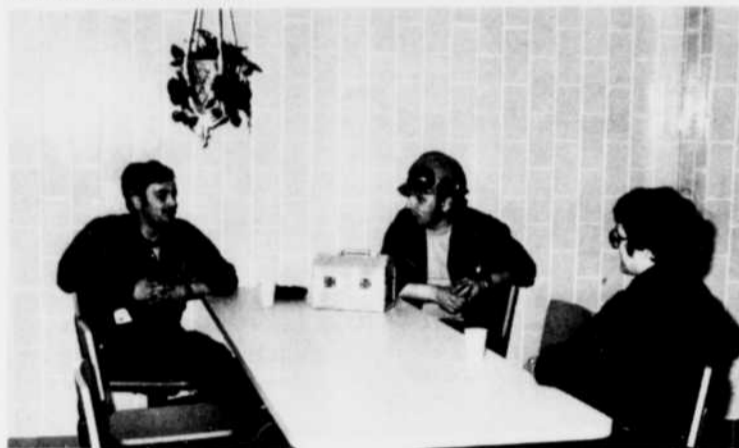
Quelques fleurs suspendues, des tables, des murs et des planchers éclatants de propreté et des chaises confortables... Ce n'est là qu'un aperçu des qualités de la nouvelle salle à manger dont peuvent profiter ces employés de l'Usine Saguenay.