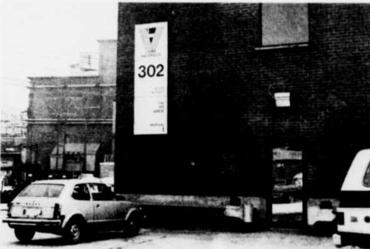
Une affiche vouée à une disparition prochaine.

Ce n'est pas la première fois que ce service change de nom depuis le début de son existence... mais, de tous les vocables essayés, le dernier est sans doute le plus agréable pour les yeux et pour les oreilles.