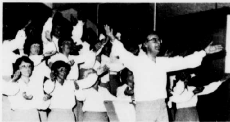
De magnifiques costumes, une chorégraphie agréable, un ensemble unique, voilà en bref ce que de centaines d'amateurs de chansons jolies ont pu apprécier lors du récent concert du Choeur du Saguenay.