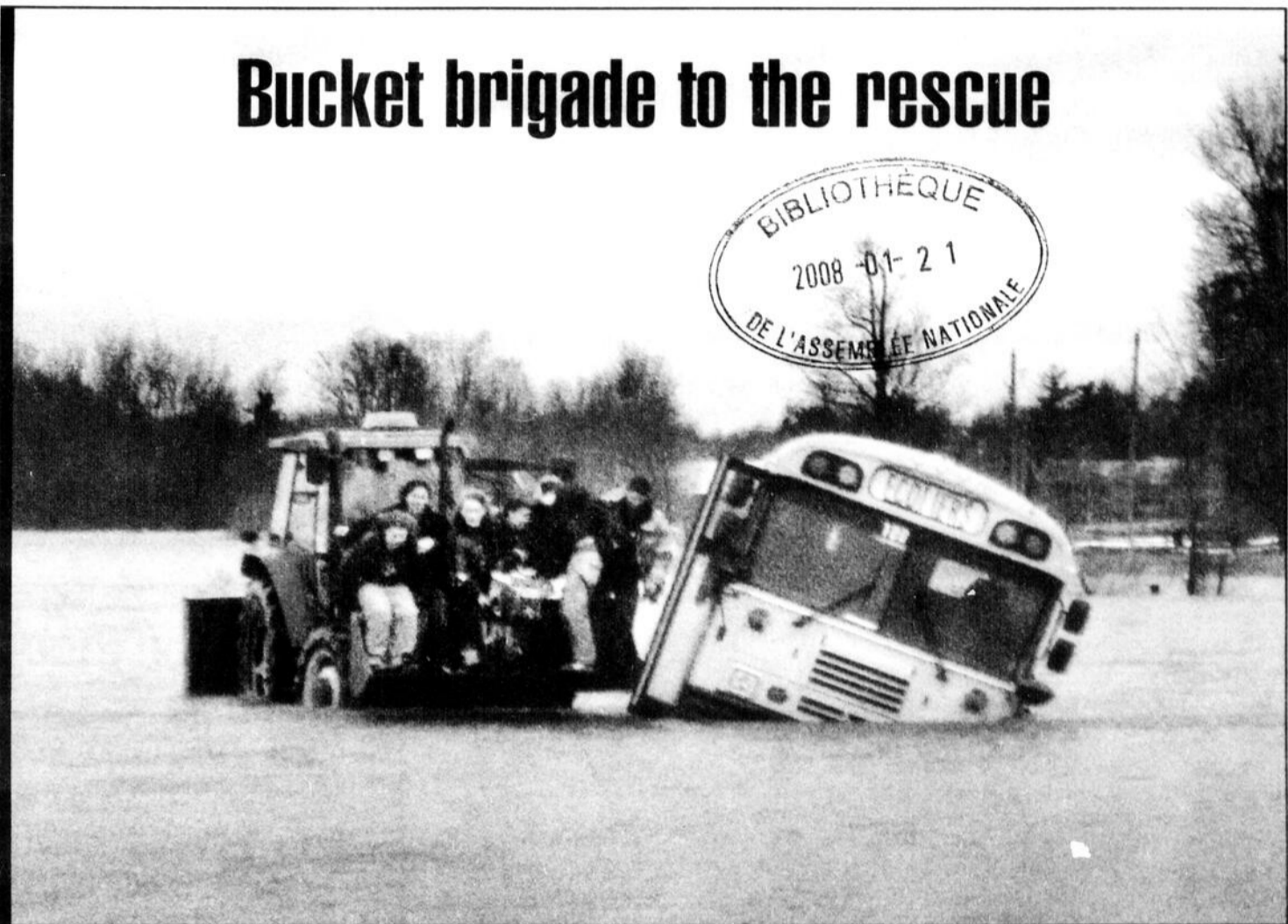
Farmers with their tractors quickly and safely carried stranded CVR students ahead to waiting buses on Fairview Rd., during Wednesday's flooding on January 9. Please see story and more flood photos on Page 6.