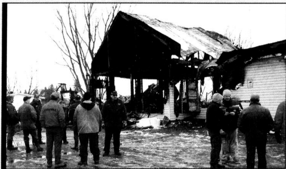
The morning after the fire, owners and employees of J.R. Caza et Frères in Cazaville surveying the destruction.

Run. Grant's Bakery in Huntingdon opened its doors to the public who viewed the baking process.