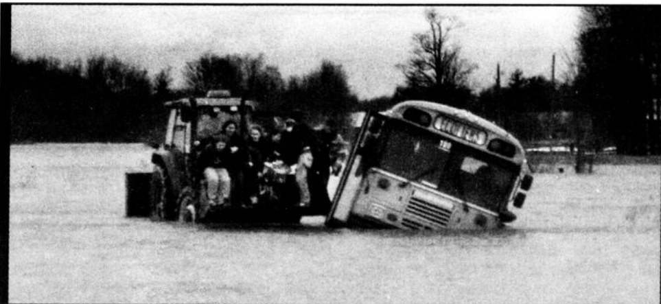
Un autobus scolaire qui ramenait chez eux des étudiants du Châteauguay Valley Regional High School d'Ormstown s'est renversé sur le chemin Fairview à Hinchinbrooke mercredi en fin d'après-midi.

Le même jour, un autre autobus a dû être détourné de sa voie en bonne partie envahie par l'eau, sur la route des Outardes à Ormstown. Le véhicule s'est immobilisé avant de faire marche arrière.