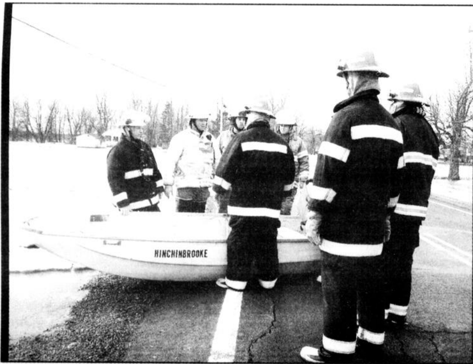
En milieu de matinée mercredi, des pompiers de Godmanchester et de Hinchinbrooke ont dû utiliser un bateau en bordure de la route 138, tout près de l'ancien restaurant Les Ruins, afin d'évacuer une femme dont la résidence était envahie par les eaux de la rivière.

D'autres branches d'arbres se sont écrasées sur les routes tandis que des arbres entiers ont été déracinés et se sont abattus sur les lignes électriques, provoquant des pannes de courant isolées tard en soirée.