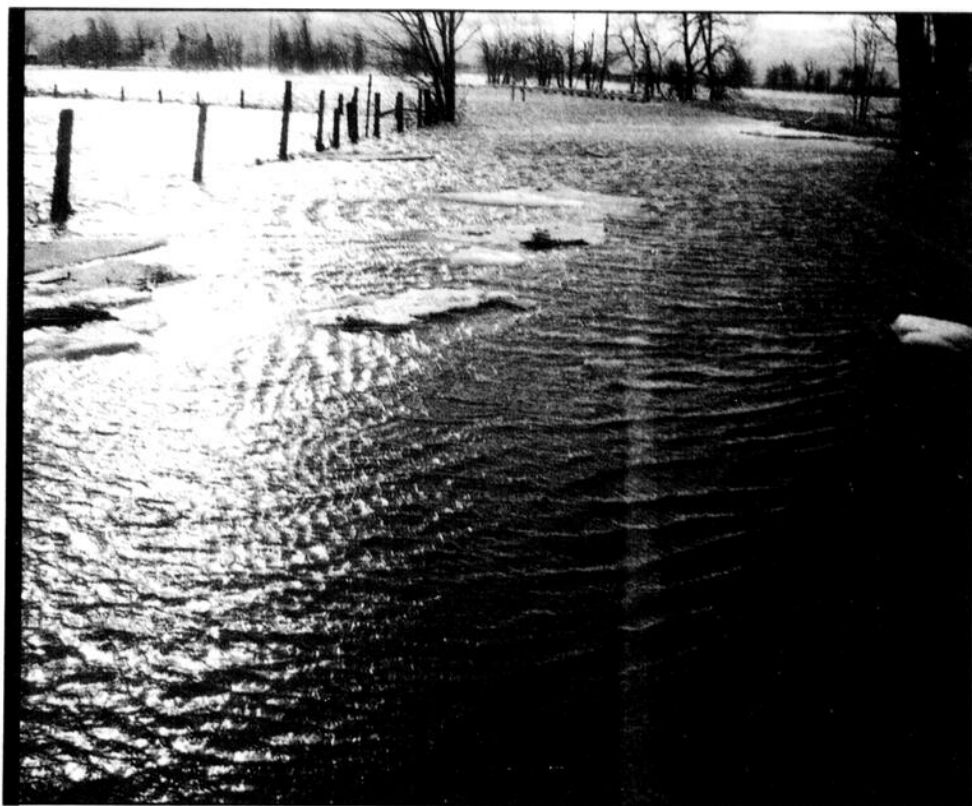
L'accès d'une portion du chemin Athelstan à la hauteur de Hinchinbrooke a dû être fermée aux véhicules, en raison d'une forte accumulation d'eau sur la chaussée.