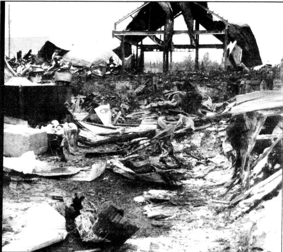
À leur arrivée sur place, les pompiers ont vu un immense brasier en train de ne faire qu'une bouchée du commerce tard jeudi soir.