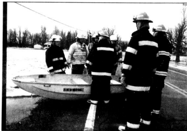
Godmanchester firemen called in Hinchinbrooke firemen with their rescue boat to extract a woman from her flood surrounded Rte. 138 house above Huntingdon.

Montreal and national media, print, radio and television newscasters camped out in Huntingdon on Tuesday and Wednesday. Several crews returned on Thursday.