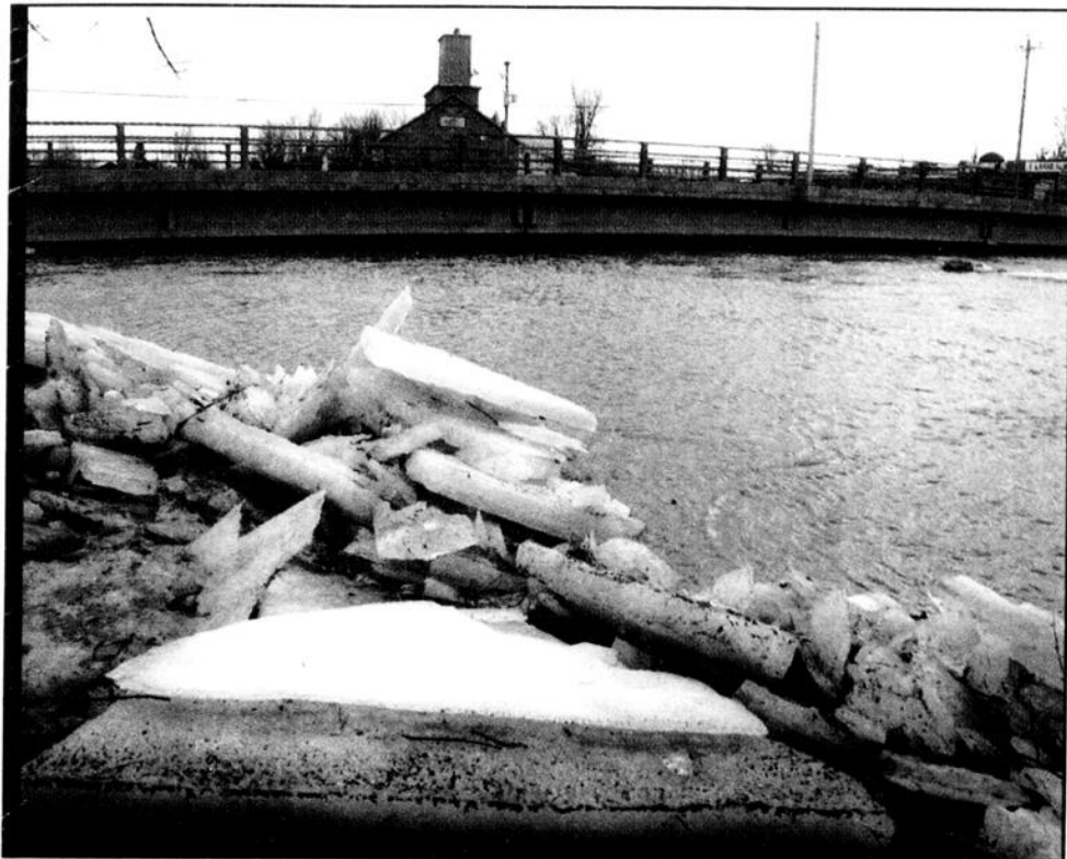
Le 8 janvier, les autorités municipales de Huntingdon ont fait état d'une augmentation considérable du niveau de la rivière Châteauguay, à la hauteur du pont de la rue Henderson.

Tuite en milieu de semaine dernière, créant des débordements qui ont nécessité des évacuations d'urgence, principalement dans les municipalités rurales à l'extérieur de Huntingdon.