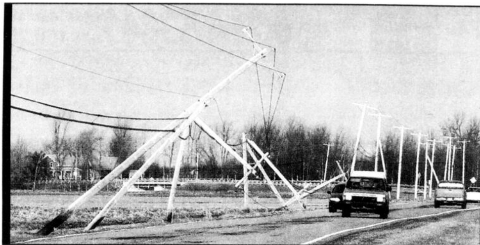
Hydro poles along Rte. 202 east of Huntingdon toppled from high winds into the flood waters on January 9, causing power outages.