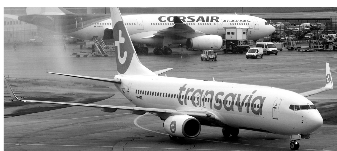
Transavia, la filiale bon marché d'Air France, prévoit transporter dix millions de passagers en 2015.

Pour y parvenir, le patron de la compagnie franco-néerlandaise veut boucler au plus vite les négociations sociales chez Air France comme chez KLM. Il a fixé la date butoir au 30 septembre chez Air France.