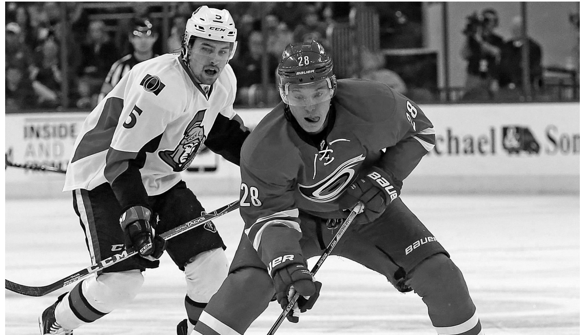
Alexander Semin a connu une saison 2014-2015 relativement difficile dans l'uniforme des Hurricanes de la Caroline.

Semin a établi clairement qu'il n'a jamais envisagé de poursuivre sa carrière dans la