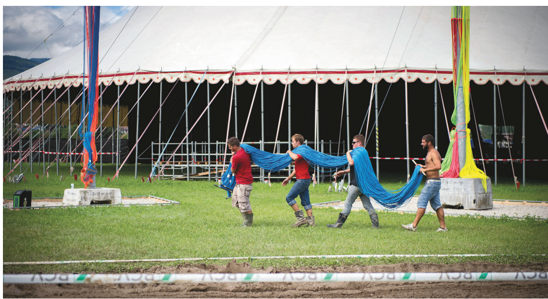
Les bénévoles peuvent travailler dans diverses divisions, dont celle du montage du site.