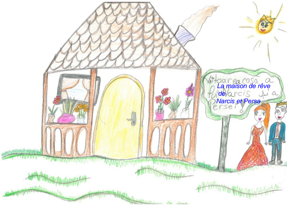
Illustration : Florin Lazlo