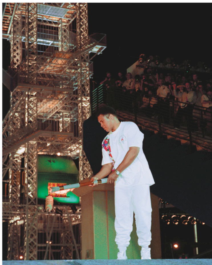
En 1996, à Atlanta, Muhammad Ali a allumé la flamme olympique lors d'une cérémonie émouvante.

Deux jours plus tard, Clay annonce qu'il devient musulman et rejoint la Nation of Islam, où il côtoiera notamment Malcolm X. La semaine suivante, il fait savoir qu'il change de nom.