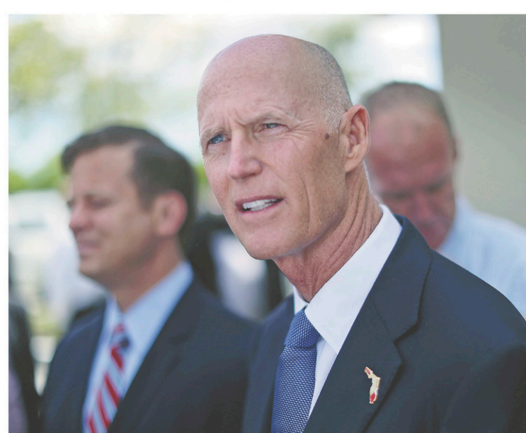
LE GOUVERNEUR DE LA FLORIDE, RICK SCOTT, S'EST RENDU À TALLAHASSEE.

Le Centre américain de surveillance des ouragans a annoncé qu'il y avait de fortes chances qu'une dépression tropicale dans le sud du golfe du Mexique se transforme en tempête tropicale tard dimanche soir ou tôt lundi matin. Elle se déplaçait à une vitesse d'environ huit kilomètres à l'heure et devait gagner en rapidité