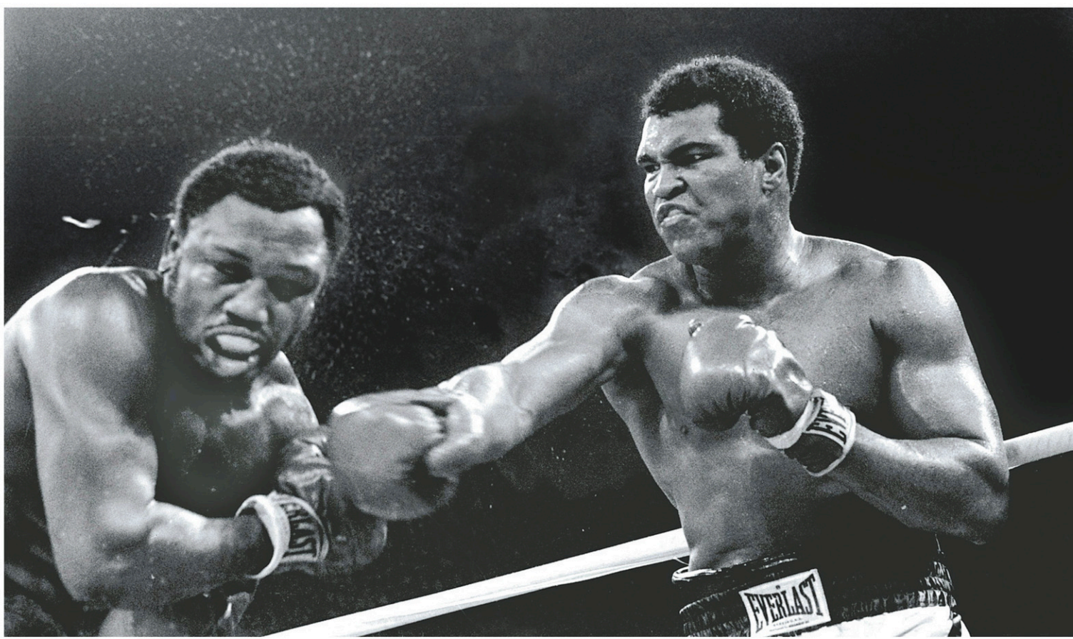
Le combat Thrilla in Manila qui opposait Ali (à droite) à Joe Frazier demeure dans les annales du sport.

Finalement, Liston ne revient pas pour le 7 e assaut. Au micro de la télévision, le nouveau champion hurle « I shook up the world! [J'ai secoué le monde entier!]» quatre fois plutôt qu'une. « I must be the greatest! [Je dois être le plus grand!]» Des soupçons de combat truqué surgissent, eux non plus jamais étayés.