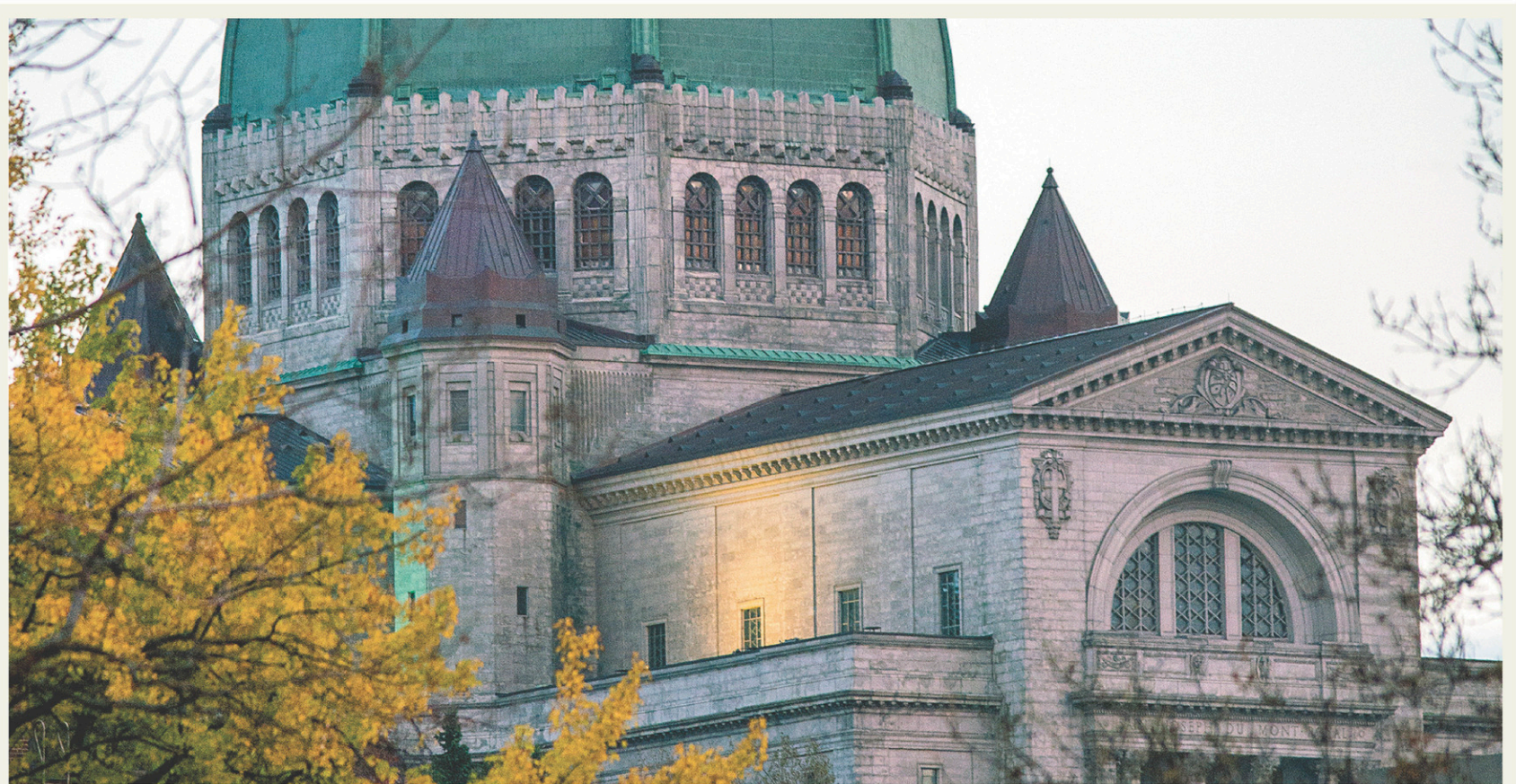
MICHAËL MONNIER LE DEVOIR