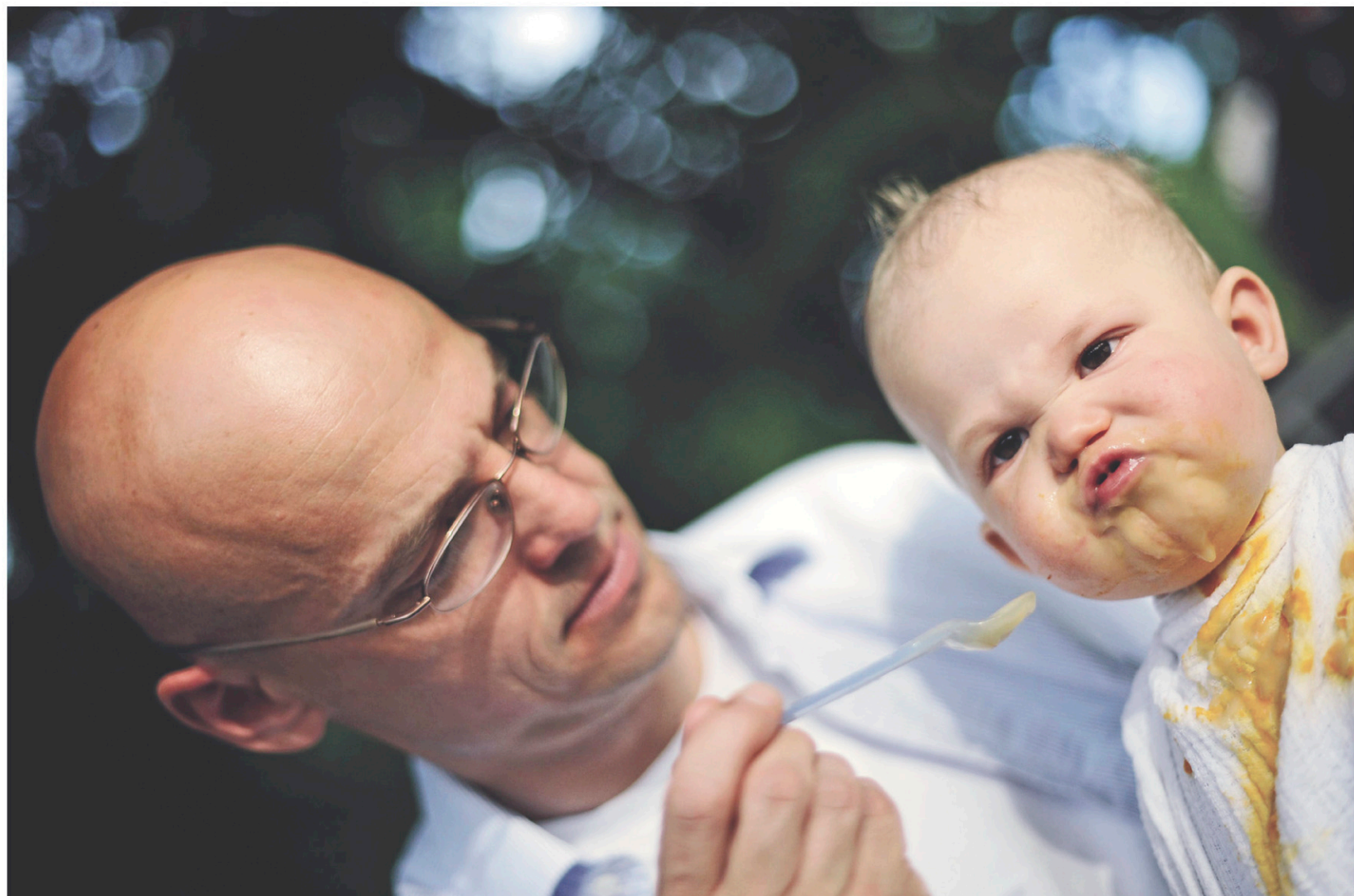
BARBARA SAX AGENCE FRANCE-PRESSE

chroniquefd@ledevoir.com sur Twitter: @FabienDeglise