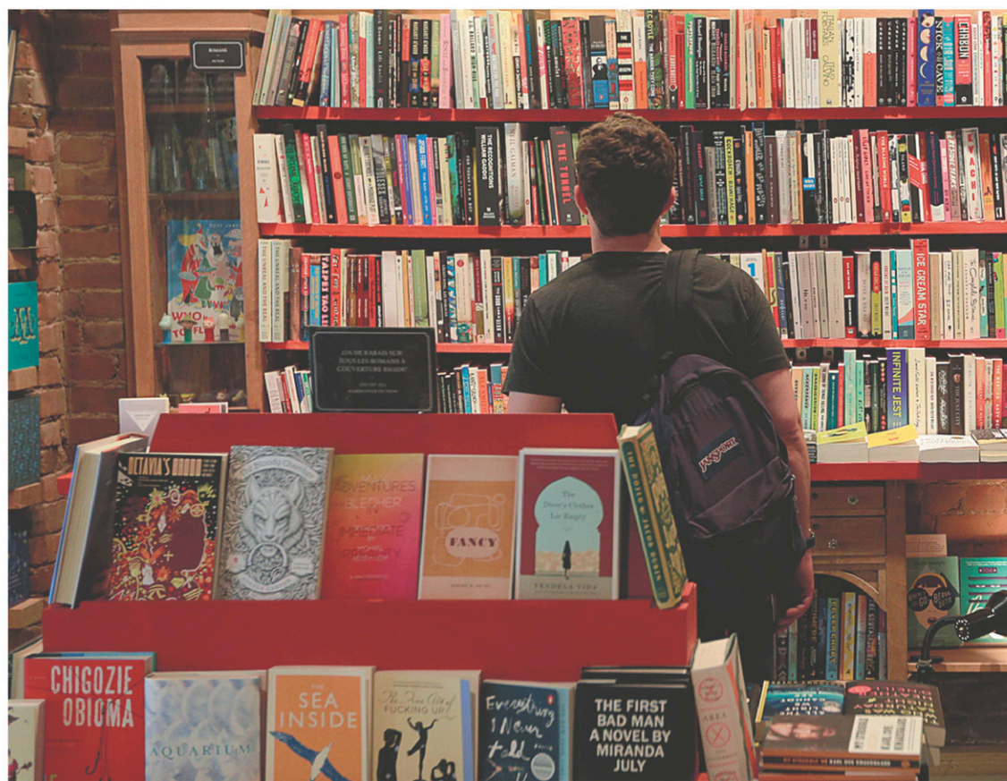
Le PTP traite la culture comme une simple marchandise.

Le PTP traite la culture comme une simple marchandise. Les avantages accordés aux grandes entreprises du Web créent une brèche