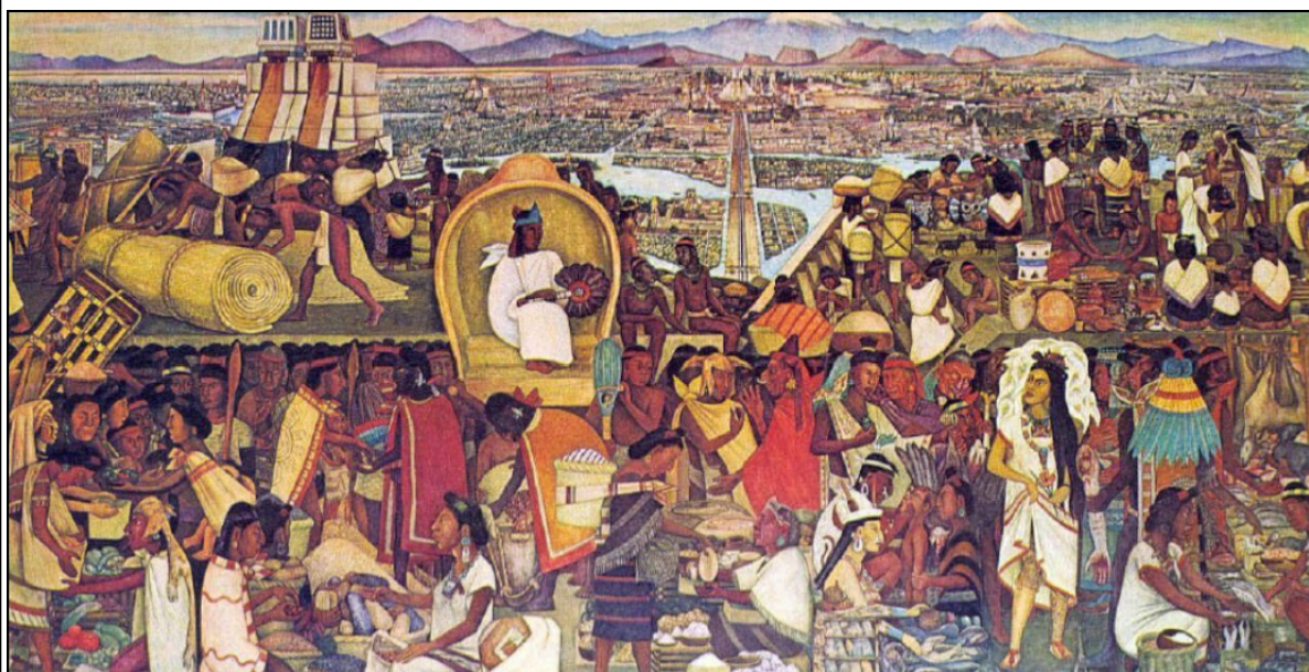
Murale du peintre mexicain Diego Rivera