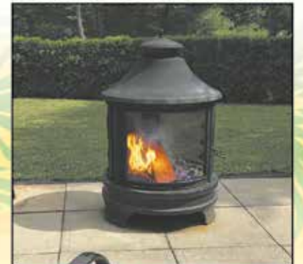
Feu dans un aménagement foyer extérieur, qui est muni d'un pare-étincelle et d'une cheminée