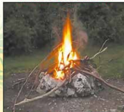
Feu à ciel ouvert