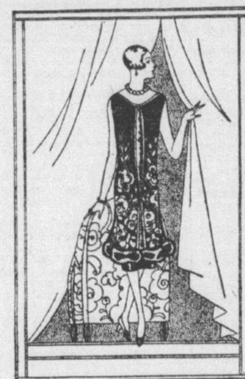
La nuance "Bois de Rose"