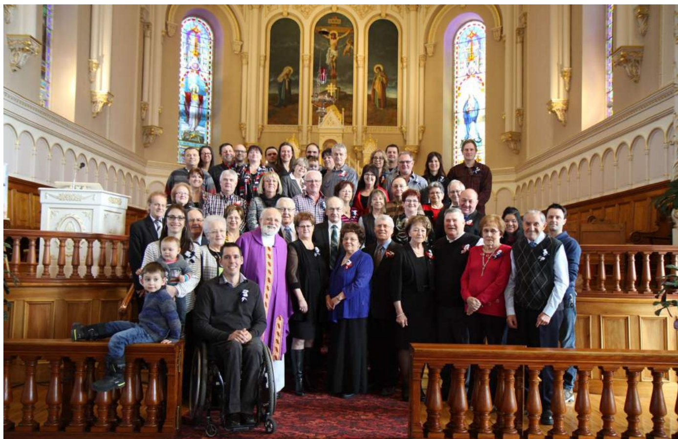
Photo : Fête de l'amour - Les couples qui fêtaient un anniversaire spécial en 2016 au 14 février dernier.

super cadeaux pour les tirages: Créations MJ, Boutique fleur Bleue, Rendez-vous des arts et de la culture, Clinique de Massothérapie et Kinésithérapie Mélanie Plante et Carl Giguère, Créations PAL, Salon haute Tendence, Librairie Sélect, Hugues Lacroix nutritionniste, Noah spa Cache à Maxime, Clinique d'Orthothérapie Caroline Lapointe. Merci aux bénévoles et à toutes les femmes qui ont participé à cette soirée.