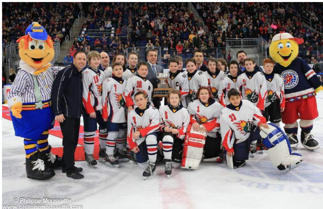
Photo : Tournoi International Peeewe 2016 au Centre Vidéotron.