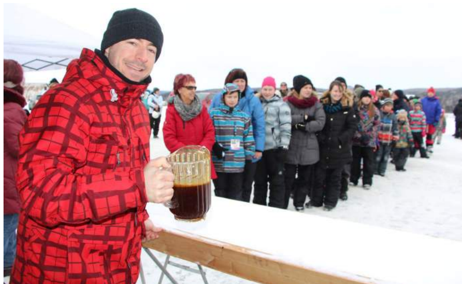
Photo: Festineige - La coulée de tire du Maire au 28 février dernier.