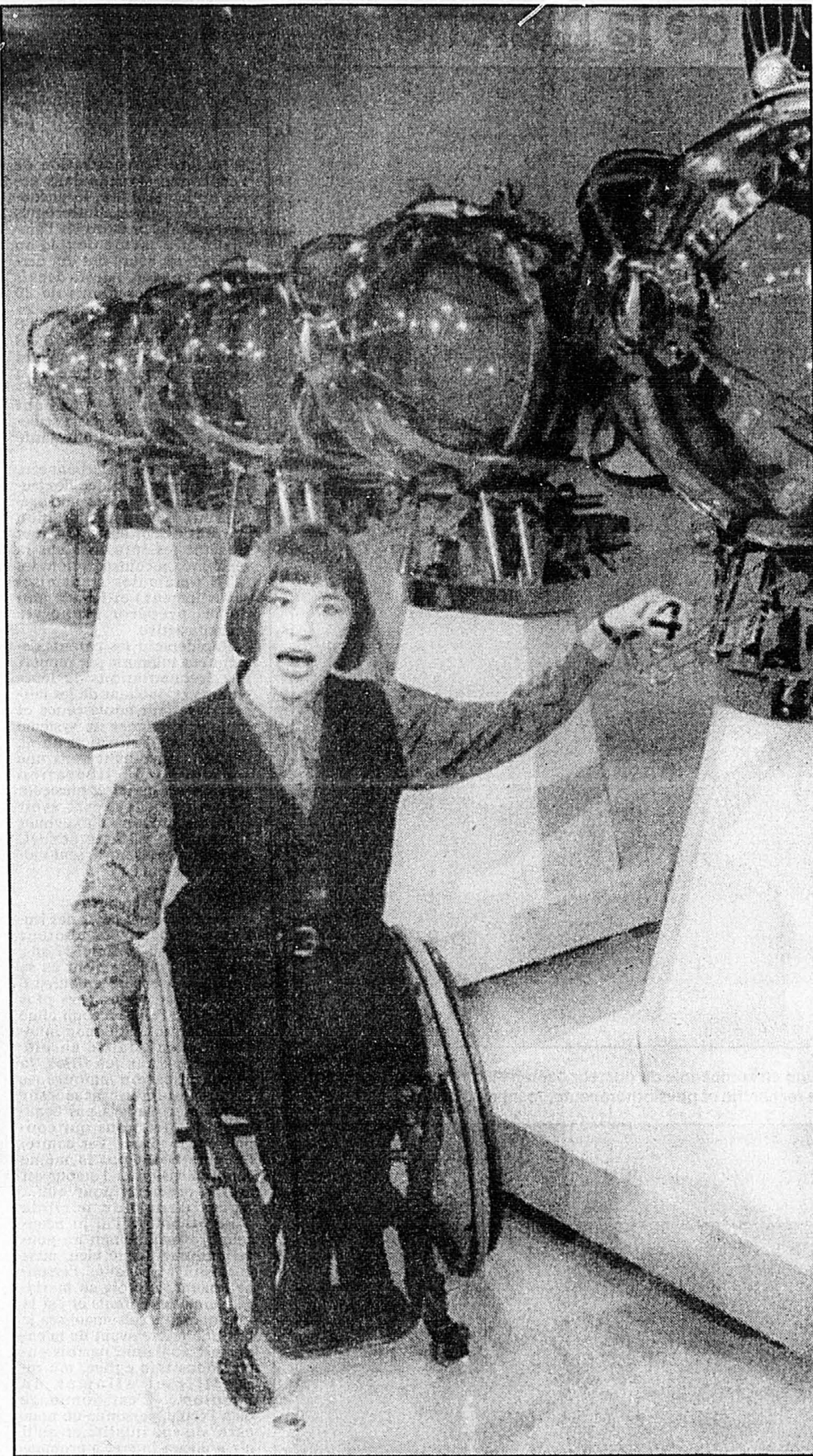
« Le 4 », lance Chantal Petitclerc avec sa proverbiale bonne humeur.

Serrez vos mouchoirs Qu'attend-elle de sa présence à la télé? La diffusion d'une autre image, plus réaliste, de la personne handicapée. « La plu-