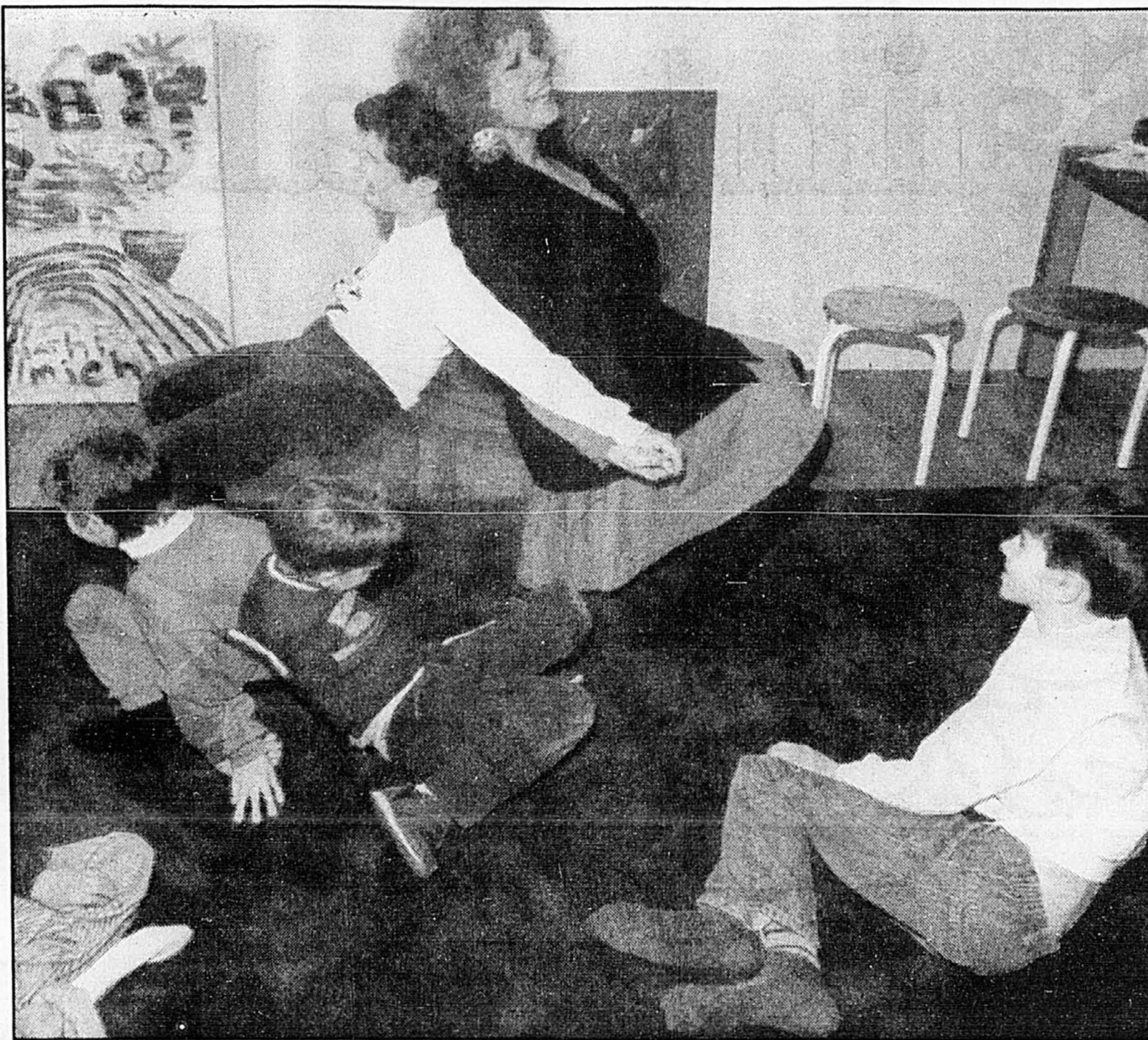
S'ils peuvent dessiner parfaitement l'hôtel de ville de Montréal deux jours après l'avoir vu, certains autistes « savants » demeurent malheureusement incapables de s'habiller ou même de compter jusqu'à dix.

Surdoués et handicapés : les causes L'autisme savant n'a pourtant rien à voir avec le génie », s'insurge le docteur Mottron lorsqu'on le questionne sur la « beauté » du phénomène. C'est plutôt un handicap. Son univers mental est envahi par les milliers de noms d'un annuaire téléphonique ou par les jours du calendrier ». Presque inutile de dire que personne n'a vraiment intérêt à les