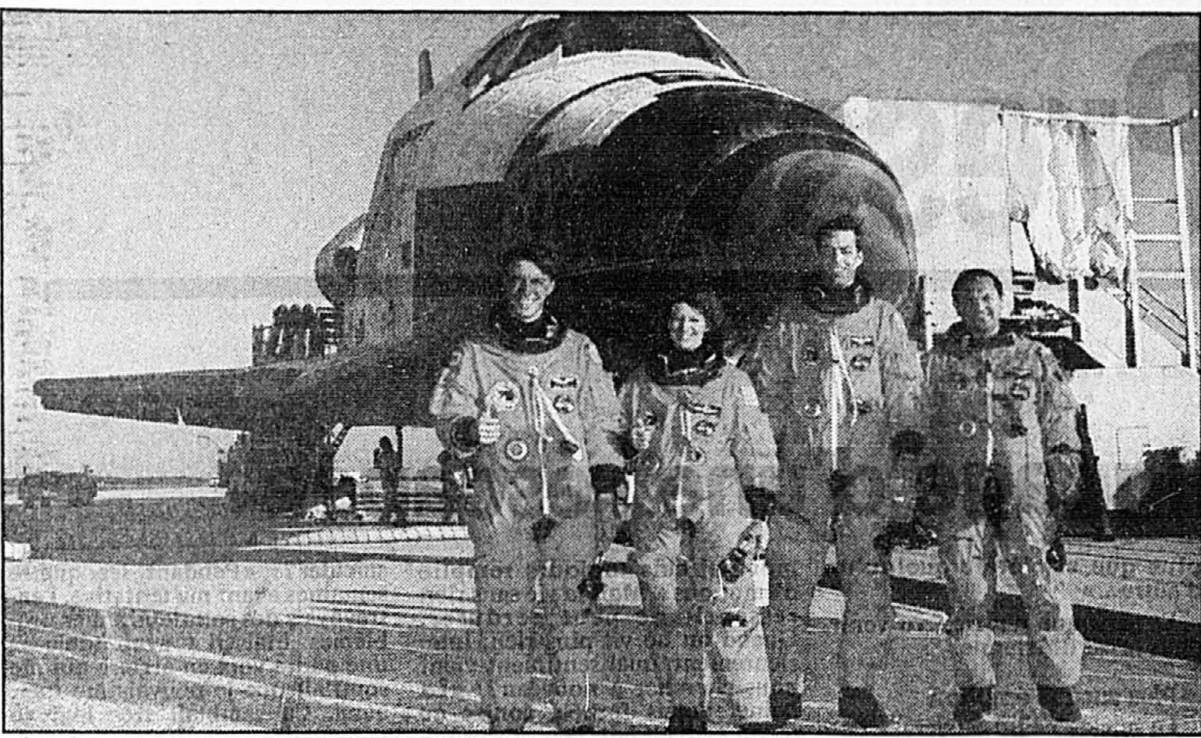
Quatre des six membres de l'équipage de la navette Discovery posent pour les photographes devant l'engin spatial quelques instants après leur retour sur terre hier matin au centre spatial de Cap Canaveral, en Floride.