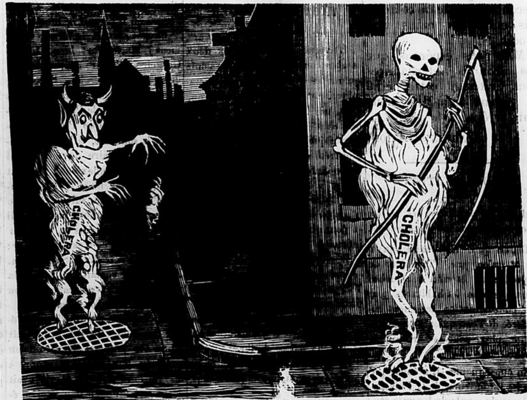
COMMENT LE CHOLÉRA SE PROPAGERA A MONTREAL.

— Ah ! par exemple ! Dieu merci, j'ai eu mieux que ça ! Est-ce que j'aurais jamais pu rien apprendre avec ce vieux mousse qui n'ai jamais été à terre ? Mais mon cousin était gentil, et le tambour, c'était son élément.