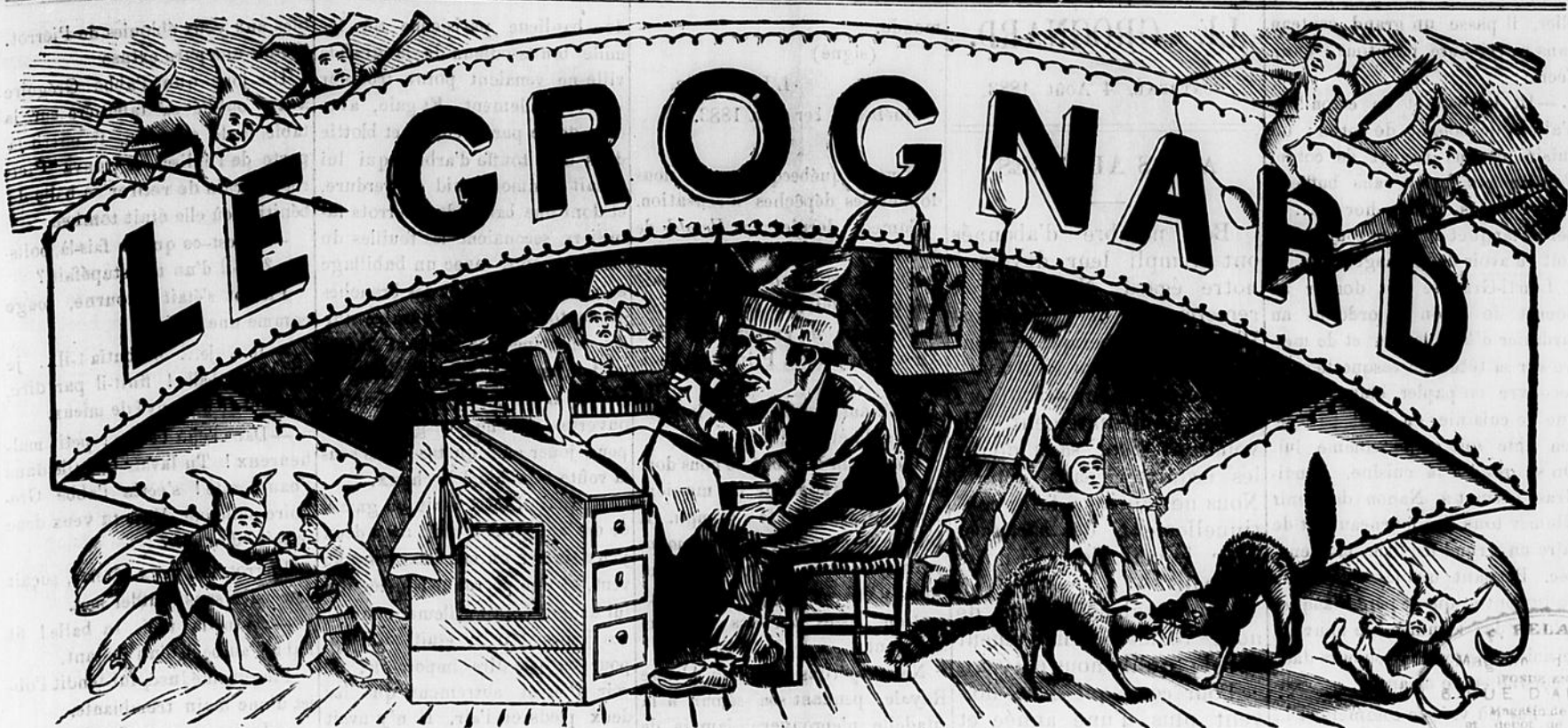
En-devant "LE VRAI CANARD."