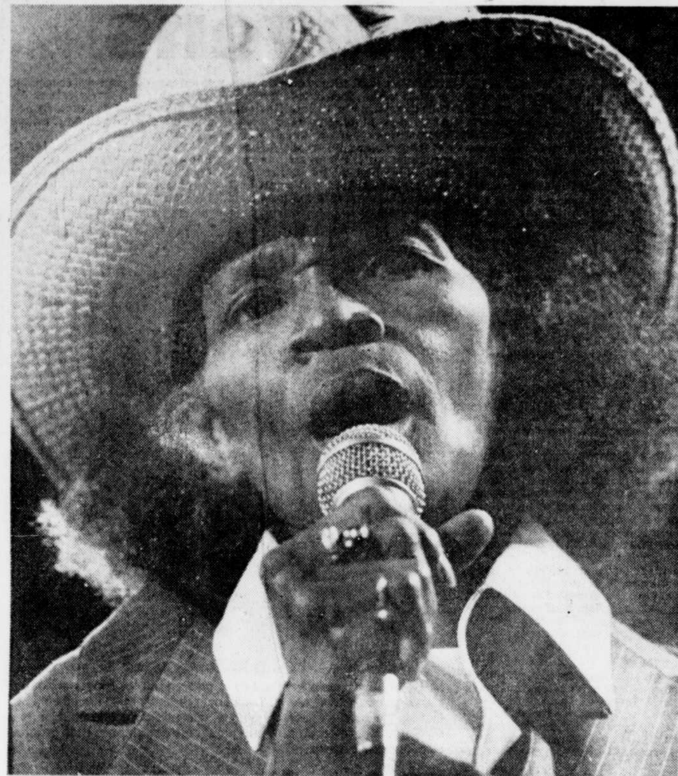
"Elle chanterait toute la nuit, si on la laissait faire."

Big Mama habite maintenant la Californie, et fait ses tournées presque exclusivement en été. Elle n'a pas d'accompagnateurs réguliers, mais choisit des musiciens dans les villes où elle passe. Elle enregistre rarement.