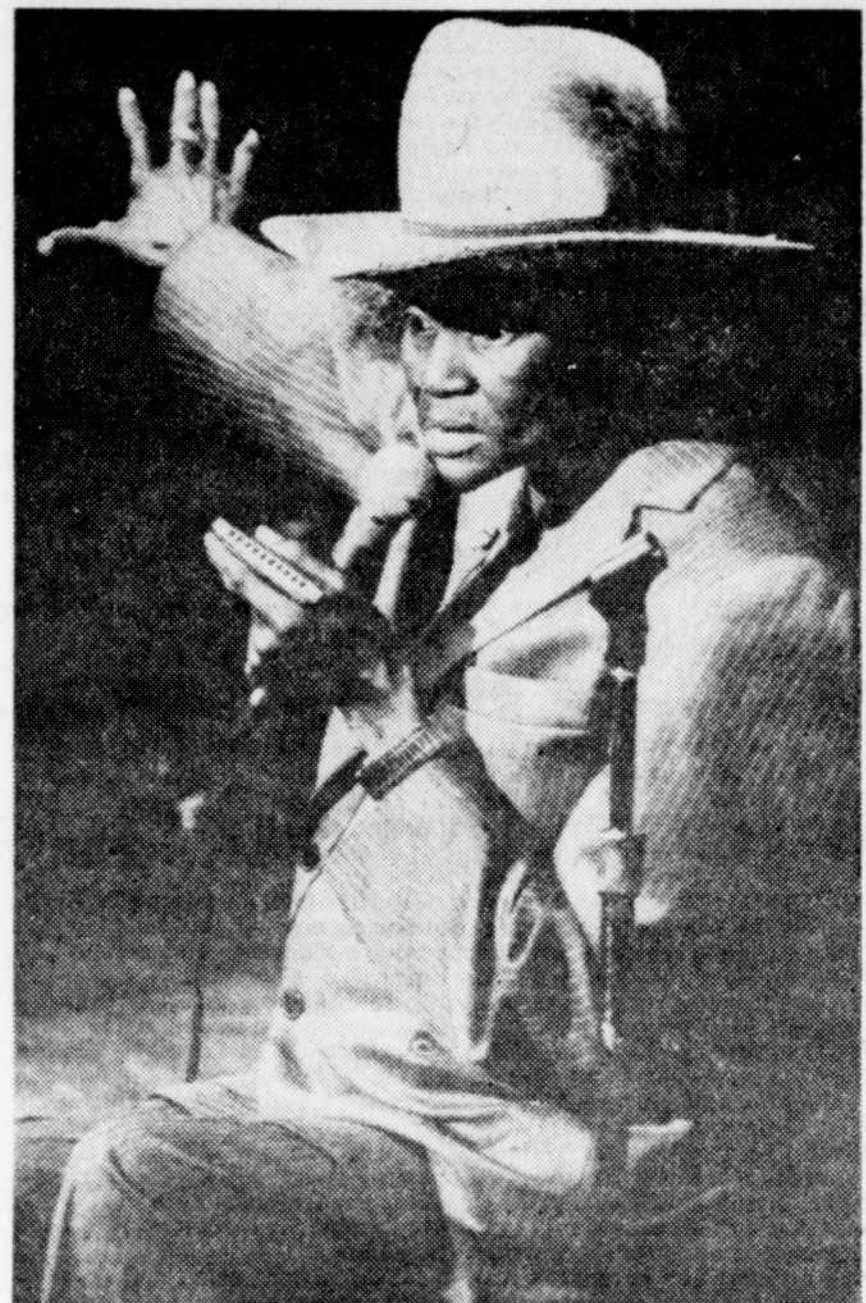
"Nous allons faire une jam session."