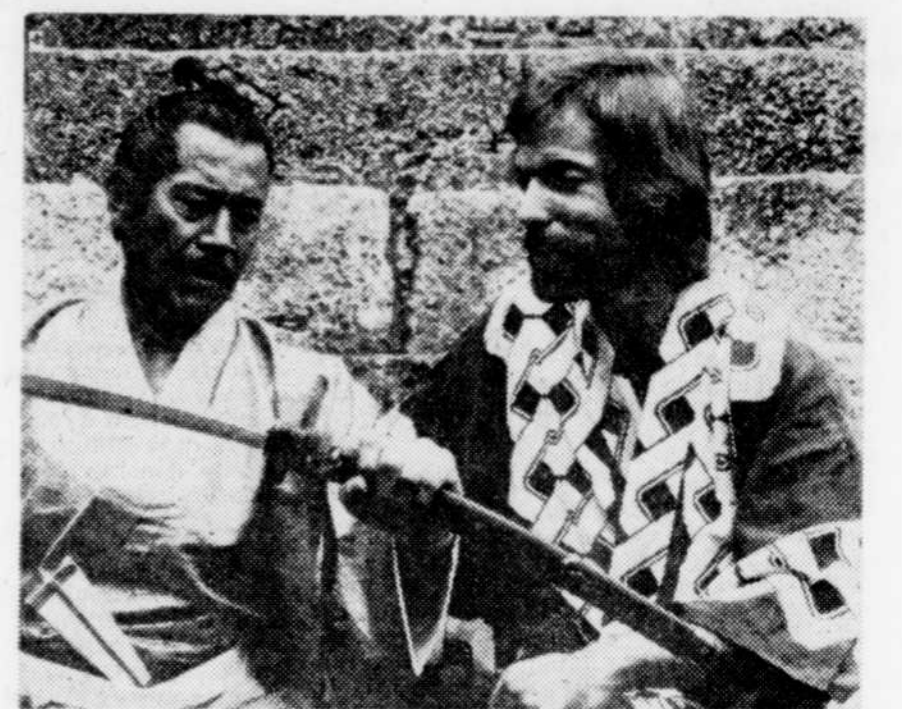
Toshirō Mifune (Toranaga) et Richard Chamberlain (Blackthorne), les deux principaux interprètes de la mini-série SHOGUN.