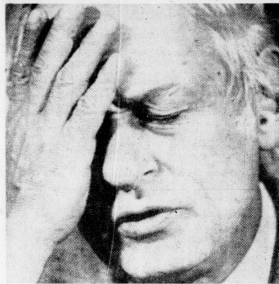
M. René Lévesque a menacé de prendre tous les moyens légaux nécessaires pour empêcher M. Trudeau de rapatrier unilatéralement la constitution. Il a aussi mentionné qu'un tel geste de la part du premier ministre du Canada permettrait au Parti québécois de remporter les prochaines élections provinciales.

Selon M. Lévesque, les Québécois auront le sentiment d'avoir été trompés. "Nous pensions à un fédéralisme basé sur les consensus, un fédéralisme de complémentarité".