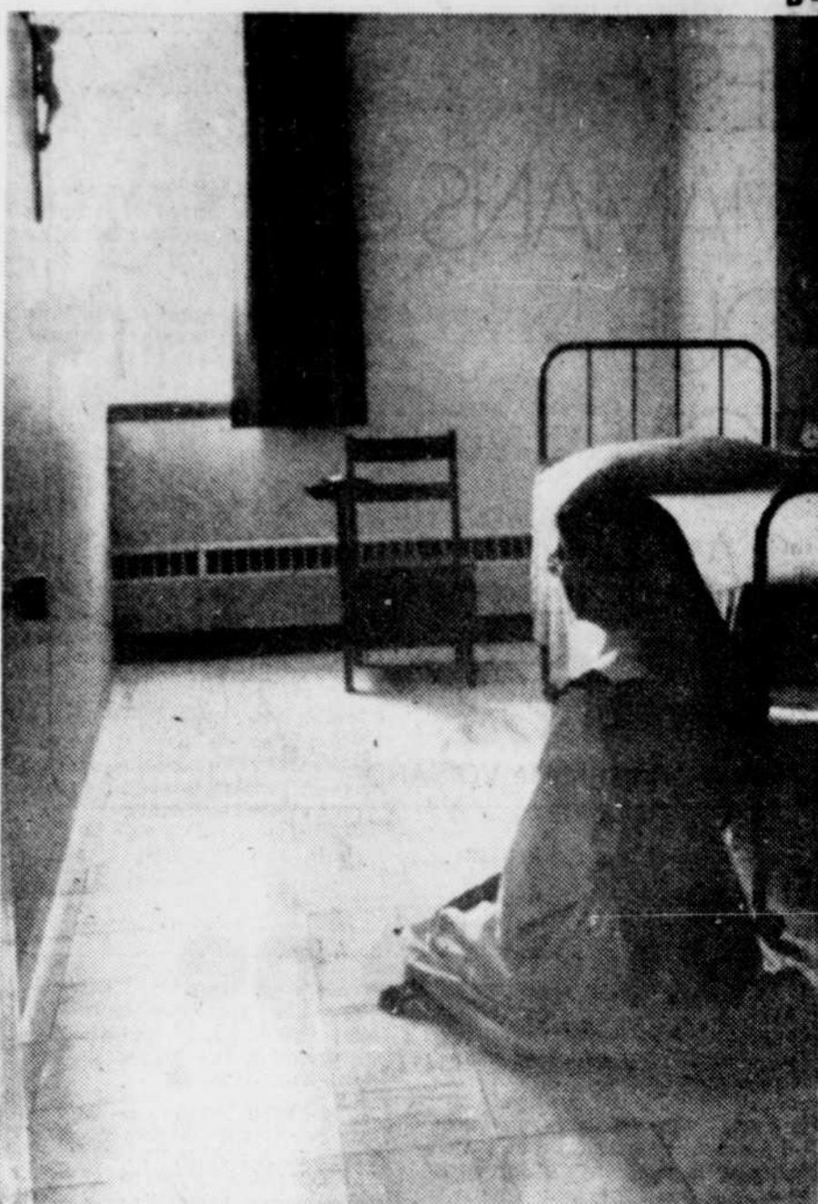
Cellule d'une moniale de l'abbaye des trappistines de Saint-Romuald.

Demain: une vie d'absolu qui donne paix et joie.