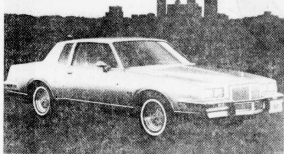
La Pontiac Grand Prix est l'une des voitures de GM fabriquées à l'usine de Sainte-Thérèse.