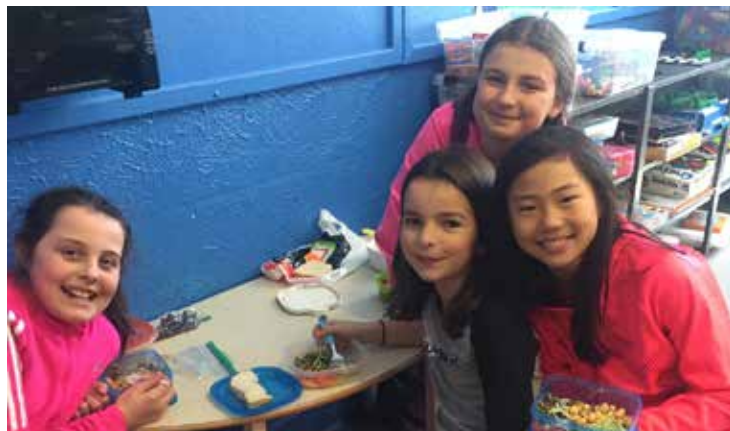
Élèves de l'École Louis-de-France lors de l'inauguration de la cuisine agro-alimentaire se préparant à manger