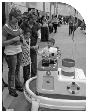
Bobbie a fait des apparitions remarquées tout au long du salon qui débutait le jeudi midi pour se terminer en après-midi, dimanche. Les enfants de la région aiment bien Bobbie eux aussi.

Les bénévoles de la Garde côtière auxiliaire canadienne ont été très présents à l'occasion du Salon Chasse et Pêche de Québec, tout au long de la longue fin de semaine du 22 au 25 mars.