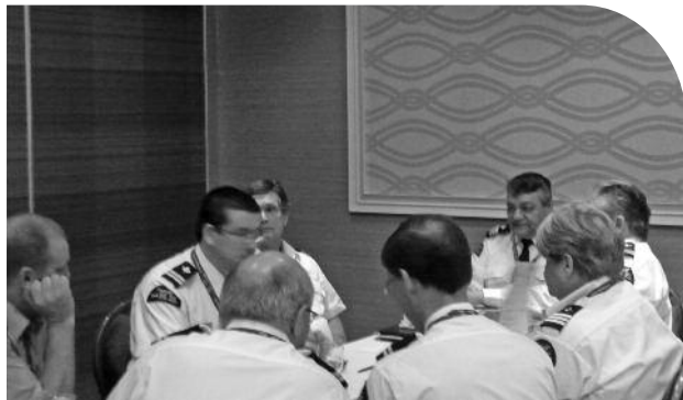
Les membres de la zone 03 discutent sérieusement et pensent à des projets pour la prochaine saison.